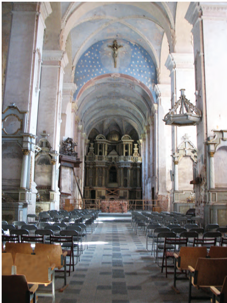
2. Kościół św. Jerzego przy klasztorze bernardynów w Kownie, miejsce obrad sejmikowych