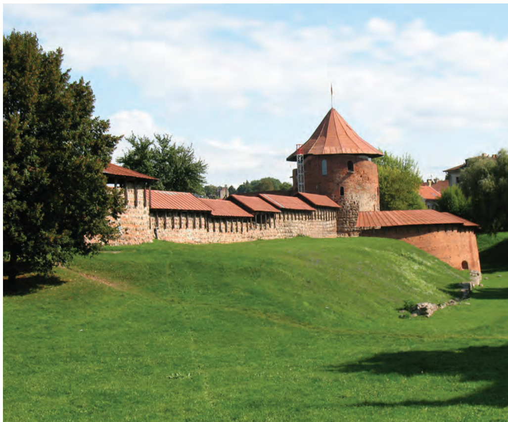
1. Zamek w Kownie, miejsce obrad sejmikowych