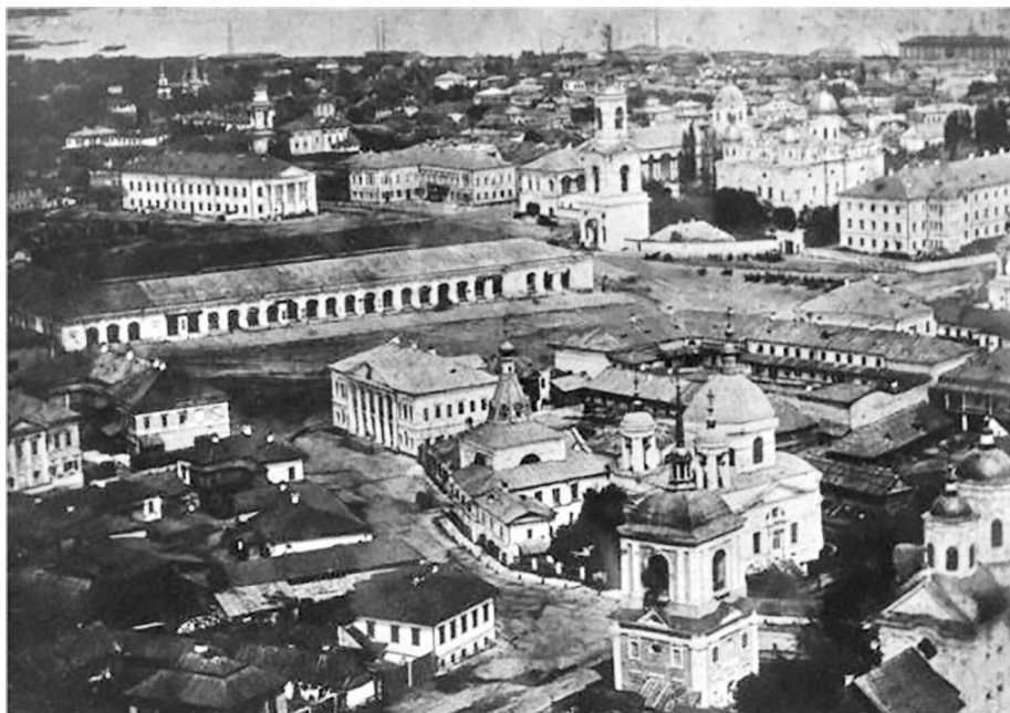
2. Plac Kontraktowy, lata 70. XIX w.; http://www.istpravda.com.ua/ukr/articles/2012/06/1/87831/ (dostęp: 11 II 2019).

pożarze w 1811 r. plac został przebudowany. Pojawiła się nowa, prostokątna siatka szerokich ulic w miejsce dawnych, średniowiecznych. Obszar dzielnicy się zwiększył i zaczęto na nim stawiać budynki mieszkalne, administracyjne i handlowe, takie jak np. Dom Kontraktowy z lat 1815–1817 (nowe centrum kupieckie) czy Gościnny Dwór.