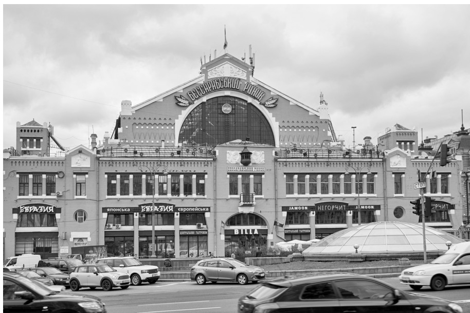
4. Targ Besarabski, 2017; fot. Cyril Levanyuk.

terenu wojskowego. Wiele lat trwały zmagania władz miasta o to, by uchylić zakaz zabudowy w obrębie esplanady, której istnienie zaburzało naturalny rozwój Kijowa. Sytuacja ta panowała aż do 1909 r. 30