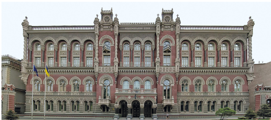
5. Narodowy Bank Ukrainy, 2017; fot. Cyril Levanyuk.