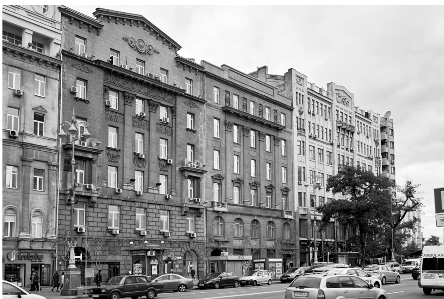
6. Banki przy Kreszczatyku, 2017; fot. Cyril Levanyuk.

Inną lokalizacją banków była ul. Wołodymyrska. Wspomniany Kobielew w latach 1910–1911 zbudował siedzibę dla kijowskiej filii Banku Włościańsko-Szlacheckiego. W dekoracji zastosowano elementy słowiańskie i bizantyjskie, na co wpływ miała pewnie bliskość Górnego Miasta, serca dawnego Kijowa. W czasach sowieckich w budynku znajdował się telegraf.