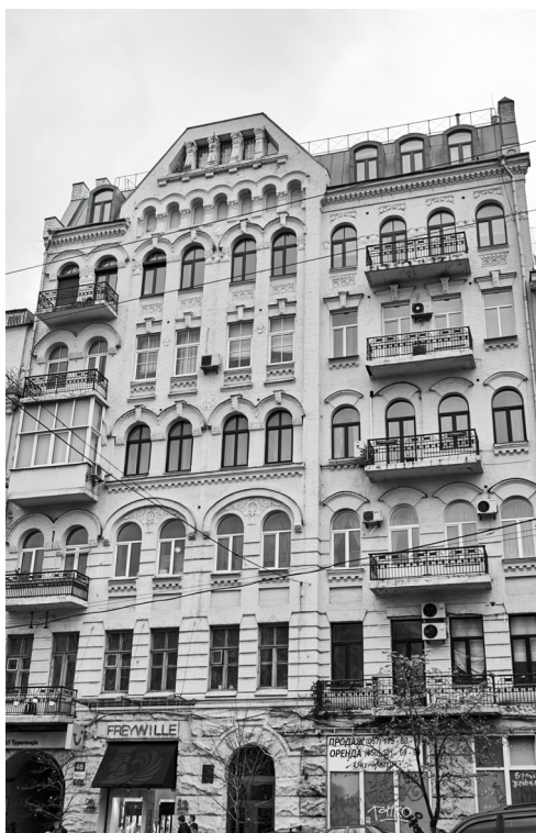
7. Dom czynszowy, ul. Wielka Wasylkowska, 2017; fot. Cyril Levanyuk.

ten miał szklane zadaszenie. Roboty budowlane rozpoczęto w 1913 r., ale nie ukończono ich do następnego roku, kiedy to wybuchła wojna, krzyżując plany inwestorów. Jedynie sklepy na parterze zdążono otworzyć.