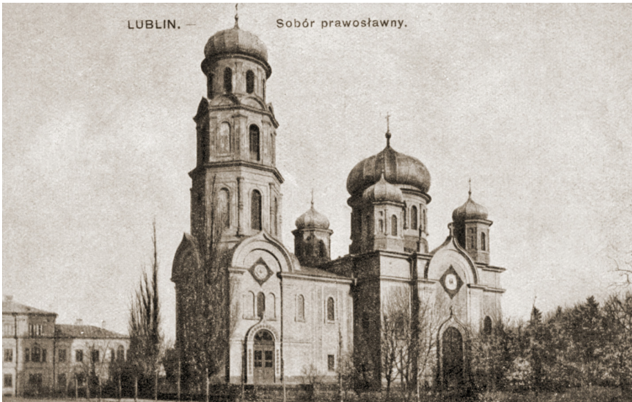
6. Lublin, pl. Litewski, sobór pw. Podwyższenia Krzyża Świętego, pocztówka, Warszawa, wyd. Fr. Karpowicz, 1 X 1915; Dział Zbiorów Specjalnych Wojewódzkiej Biblioteki Publicznej w Lublinie, sygn. U-4642 (9).

bizantyjskiego lub moskiewsko-bizantyjskiego” lubelski sobór był budowlą o czterokondygnacyjnej wieży-dzwonnicy widocznej niemalże z każdego punktu miasta. Część nawową wieńczyły wieżyczki zakończone cebulastymi kopułkami tworzącymi „piatyglawije” (z centralną kopułką większą od pozostałych umieszczonych w narożach korpusu).