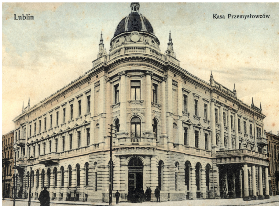
8. Lublin, ul. Krakowskie Przedmieście 56, Dom Kasy Pożyczkowej Przemysłowców Lubelskich, pocztówka, Warszawa, nakł. J. Ślusarskiego, 1911; Dział Zbiorów Specjalnych Wojewódzkiej Biblioteki Publicznej w Lublinie, sygn. U-5836.

budynkiem, przy Krakowskim Przedmieściu, znajdowała się nieruchomość należąca do Kościoła ewangelickiego, a dalej aż do Ogrodu Saskiego, wzdłuż całej północnej pierzei ulicy, od lat 80. XIX w. do początku XX w. stawiano wyłącznie cztero- i pięciokondygnacyjne kamienice czynszowe. Południowa pierzeja nowszego odcinka Krakowskiego Przedmieścia zabudowywała się nie tylko budynkami mieszkalnymi, ale także gmachami użyteczności publicznej.