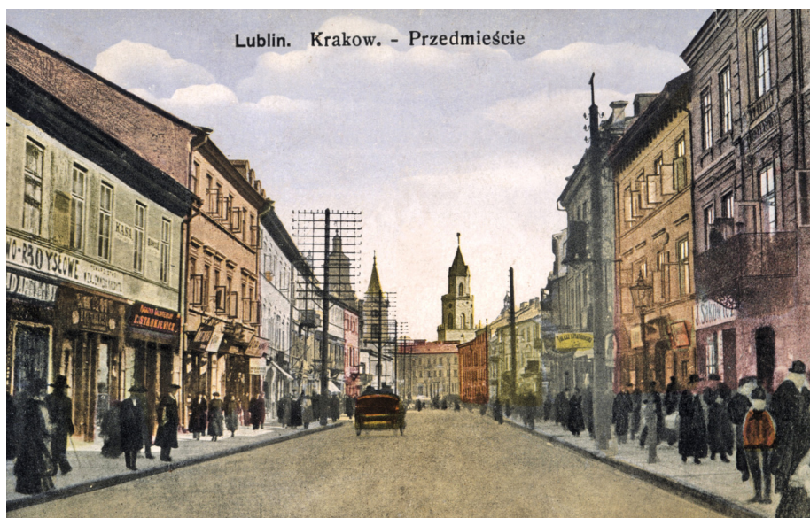
4. Lublin, Krakowskie Przedmieście (widok w kierunku starego miasta), pocztówka, Lublin, wyd. U.W.Sz., 1916; Dział Zbiorów Specjalnych Wojewódzkiej Biblioteki Publicznej w Lublinie, sygn. U-4307.

W połowie wieku plac musztry był już zbędny i inżynier wojewódzki Feliks Bieczynski wystąpił o jego zazielenienie. Po utworzeniu guberni lubelskiej w 1837 r. w pałacu tzw. Radziwiłłowskim umieszczono lokale Rządu Gubernialnego Lubelskiego. Dopiero w latach 1859–1861 wybudowano obok (na osi dawnego placu musztry) nowy gmach dla tego organu administracji 43 . W 1859 r., gdy architekt Julian Ankiewicz sporządzał projekt tej reprezentacyjnej siedziby, mającej stanąć po północnej stronie placu, napisał: „Plac przeznaczony na wzniesienie budowli [...] jest najpiękniejszym placem w Lublinie. Projekt na gmach ze względu na taką jego sytuację pod względem masy budowli i obrobienia szczegółów chociażby w skromnym zakresie powinien być ozdobą miejscowości” 44 . Sam plac stał się miejscem spotkań mieszkańców,