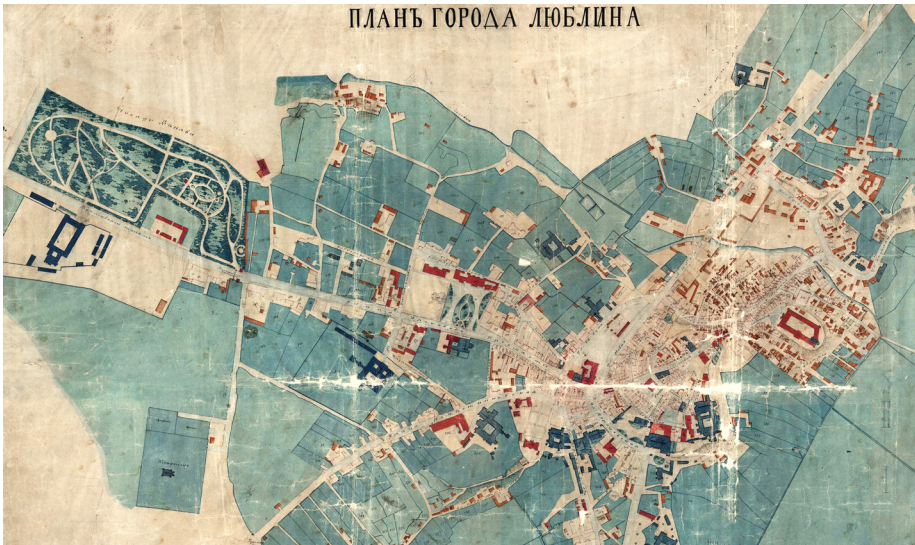
1. Plan goroda Lublina (fragment), na planie oznaczono przebieg ul. Krakowskie Przedmieście, Stare Miasto „w murach”, pl. Litewski i Ogród Saski

zawierające projekty nowych budynków, nie stanowiły przedmiotu szczególnego zainteresowania z uwagi na ukierunkowanie badań na historię społeczno-gospodarczą miasta 5 i jej kontekst polityczny.