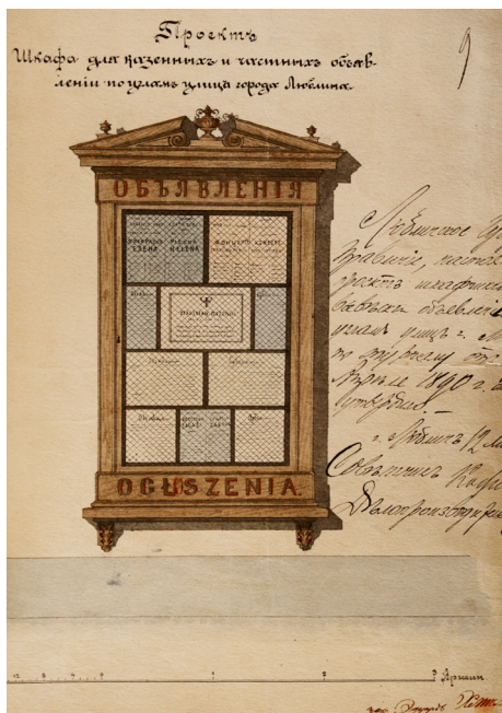
9. Projekty szafek na ogłoszenia, Archiwum Państwowe w Lublinie, Akta miasta Lublina, sygn. 5980: Ob ustrojstve škafikov dlá vyveski ob'ávenij po ulicah gor. Lúblina, k. 13, 14.