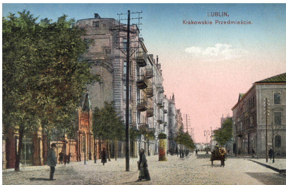
7. Lublin, Krakowskie Przedmieście (ostatni, końcowy fragment, widok od strony zachodniej, po stronie lewej pierzeja północna, po stronie prawej pierzeja południowa z budynkami użyteczności publicznej), pocztówka, Kraków, wyd. „Sztuka”, 1916, sygn. U-1876.

Przedmieściem, pozbawione substandardowej zabudowy charakterystycznej dla dzielnic przyfabrycznych, przekształcało się w elegancki pasaż handlowy i najdogodniejsze miejsce lokalizacji banków, instytucji kredytowych, hoteli, a także sądu okręgowego z wydziałem hipotecznym 53 .