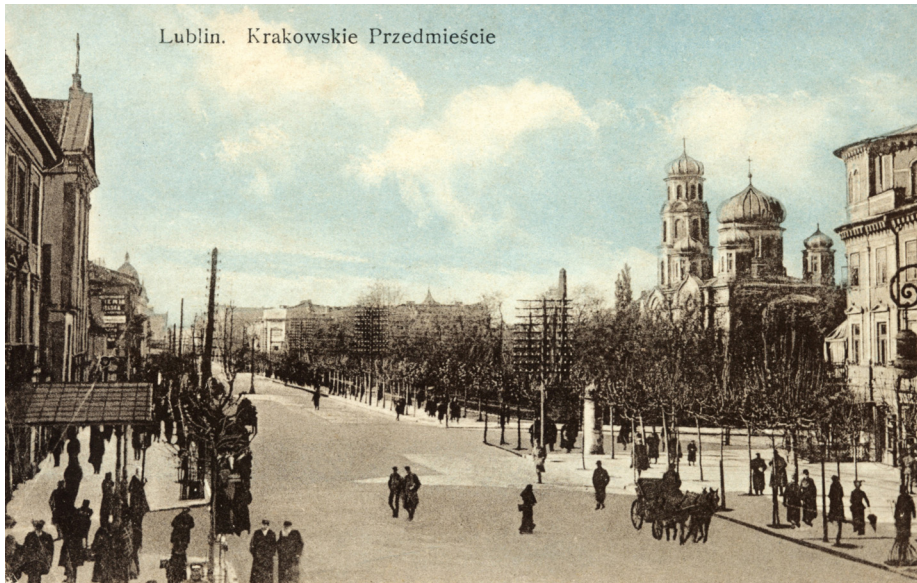
5. Lublin, Krakowskie Przedmieście (na odcinku pl. Litewskiego, po lewej stronie kościół i klasztor pokapucyński, po prawej stronie fragment Hotelu Europejskiego), pocztówka, Warszawa, Łódź, wyd. A.J. Ostrowski, 1915; Dział Zbiorów Specjalnych Wojewódzkiej Biblioteki Publicznej w Lublinie, sygn. U-5725 (5).

a wokół pomnika Unii Lubelskiej gromadzili się na ławkach w ciepłe dni wiosenne i letnie otoczeni powszechną czcią weterani wojen napoleońskich 45 .