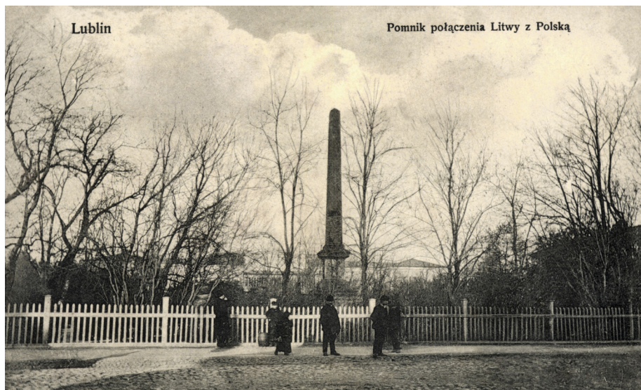
3. Lublin, pl. Litewski, pomnik Unii Lubelskiej, pocztówka, Warszawa, nakł. J. Slisarski, ok. 1915; Dział Zbiorów Specjalnych Wojewódzkiej Biblioteki Publicznej w Lublinie, sygn. U-1637.

Krakowskie Przedmieście wraz ze wspomnianą przebudową pałacu tzw. Radziwiłłowskiego, a także po wybudowaniu w bezpośrednim sąsiedztwie tej ulicy i placu musztry ważnych dla funkcjonowania miasta budynków: „Komisji Obwodowej, Komory Celnej, Wagarni i Składow” 33 powoli przeobrażało się w główną ulicę miasta. W 1839 r. była to już „najpiękniejsza z ulic Lubelskich, szeroka, prosta i równa. [...] wielki świat Lublina, tu największy ruch ujrzyć można” 34 .