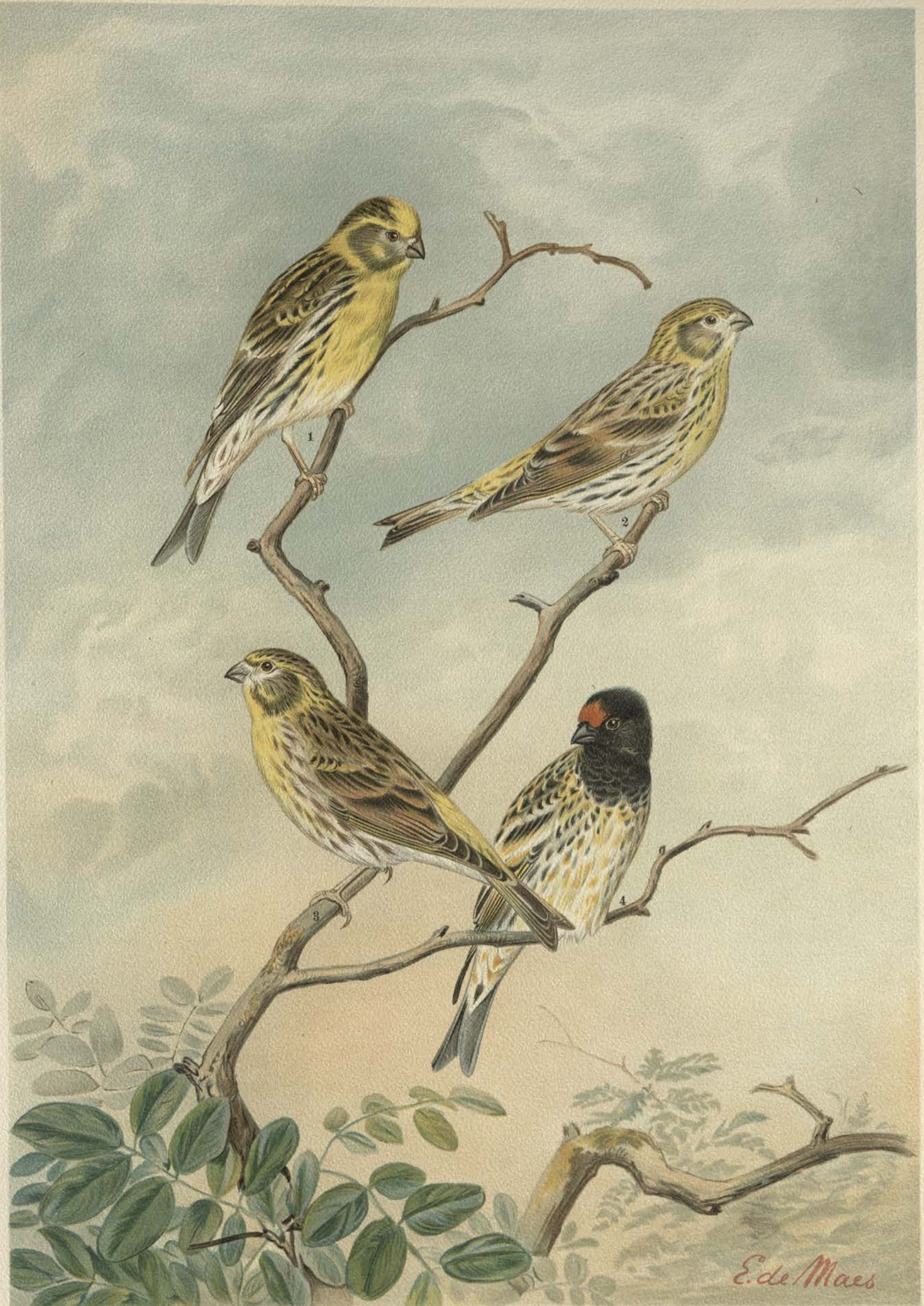
Serinus serinus (L.). Girlitz. 1 Männchen im Sommer, 2 Weibchen, 3 Männchen im Herbst.