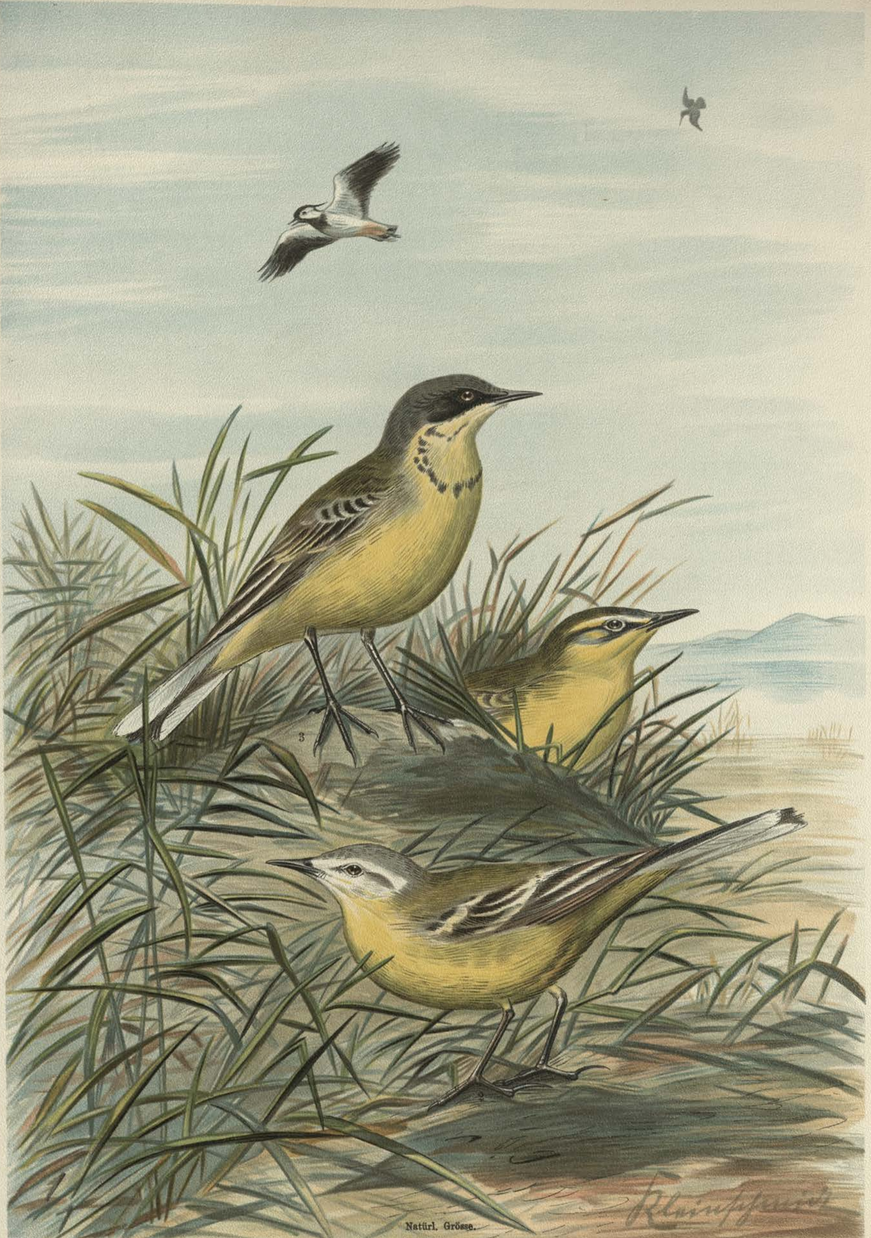
Budytes taivanus Swinhoe. Chinesische Schafstelze. Budytes flavus beema Sykes. 1 Männchen. 2 altes Männchen im Sommer. Budytes flavus borealis (Sundevall). Nordische Schafstelze. 3 altes Männchen im Frühling.