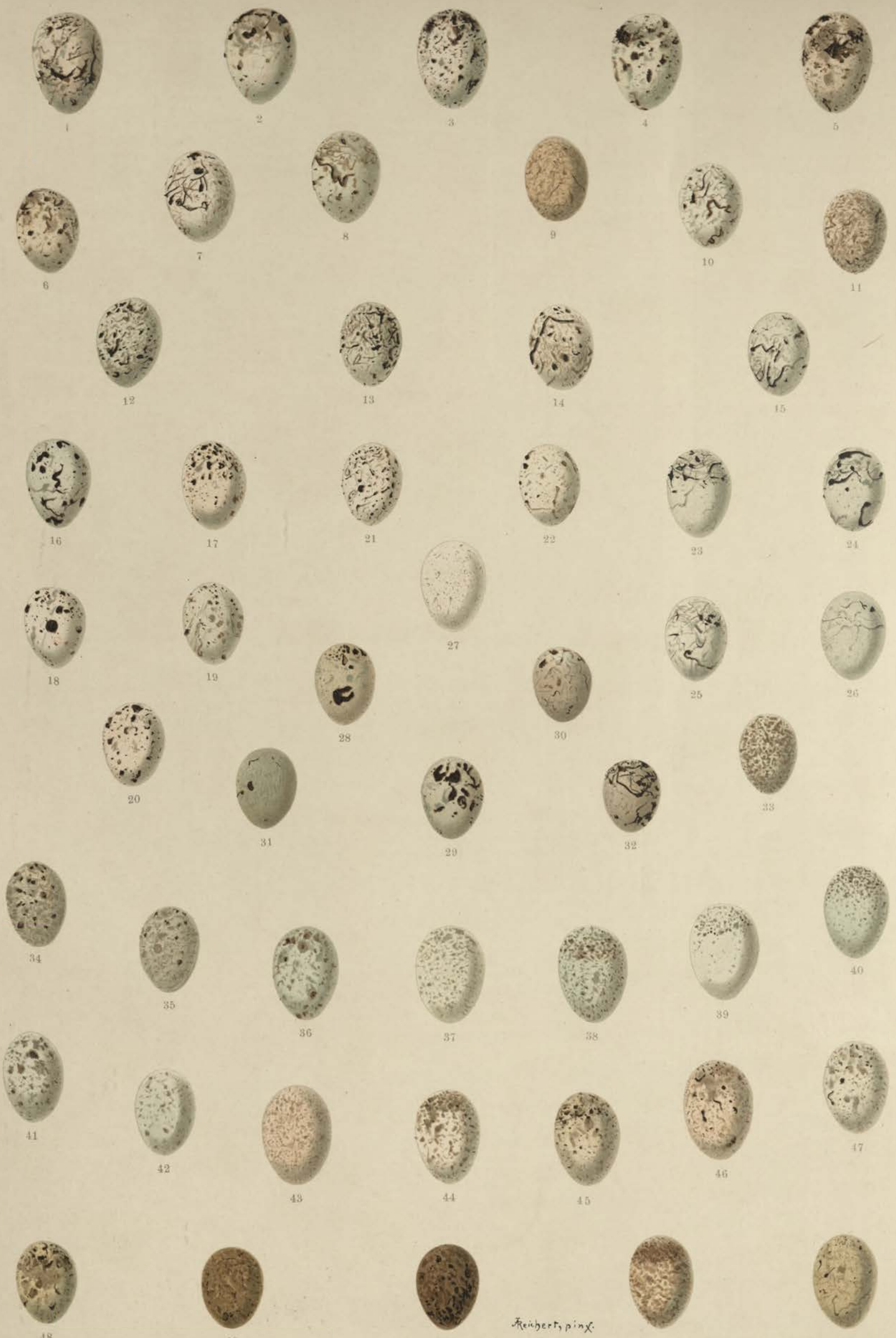
1—5 Miliaria calandra (L), Grauammer; 6—11 Emberiza citrinella L, Goldammer; 12—15 Emberiza cirrus L, Zaun-Ammer; 16—20 Emberiza hortulana L, Gartenammer; 21—22 Emberiza caesia Cretschmar, Grauer Ortolan; 23—26 Emberiza cia L, Zip-Ammer; 27 Emberiza leucocephala Gmel, Fichtenammer; 28—32 Emberiza schoeniclus (L), Rohr-Ammer; 33 Emberiza rustica Pall, Waldammer; 34—35 Emberiza aureola Pall, Weidenammer; 36—40 Emberiza melanocephala Scopoli, Kappenammer; 41—42 Emberiza luteola Sparrm., Braunkehliger Ammer; 43—47 Plectrophenax nivalis (L), Schnee-Ammer; 48—52 Calcarius lapponicus (L.), Lerchen-Spornammer.