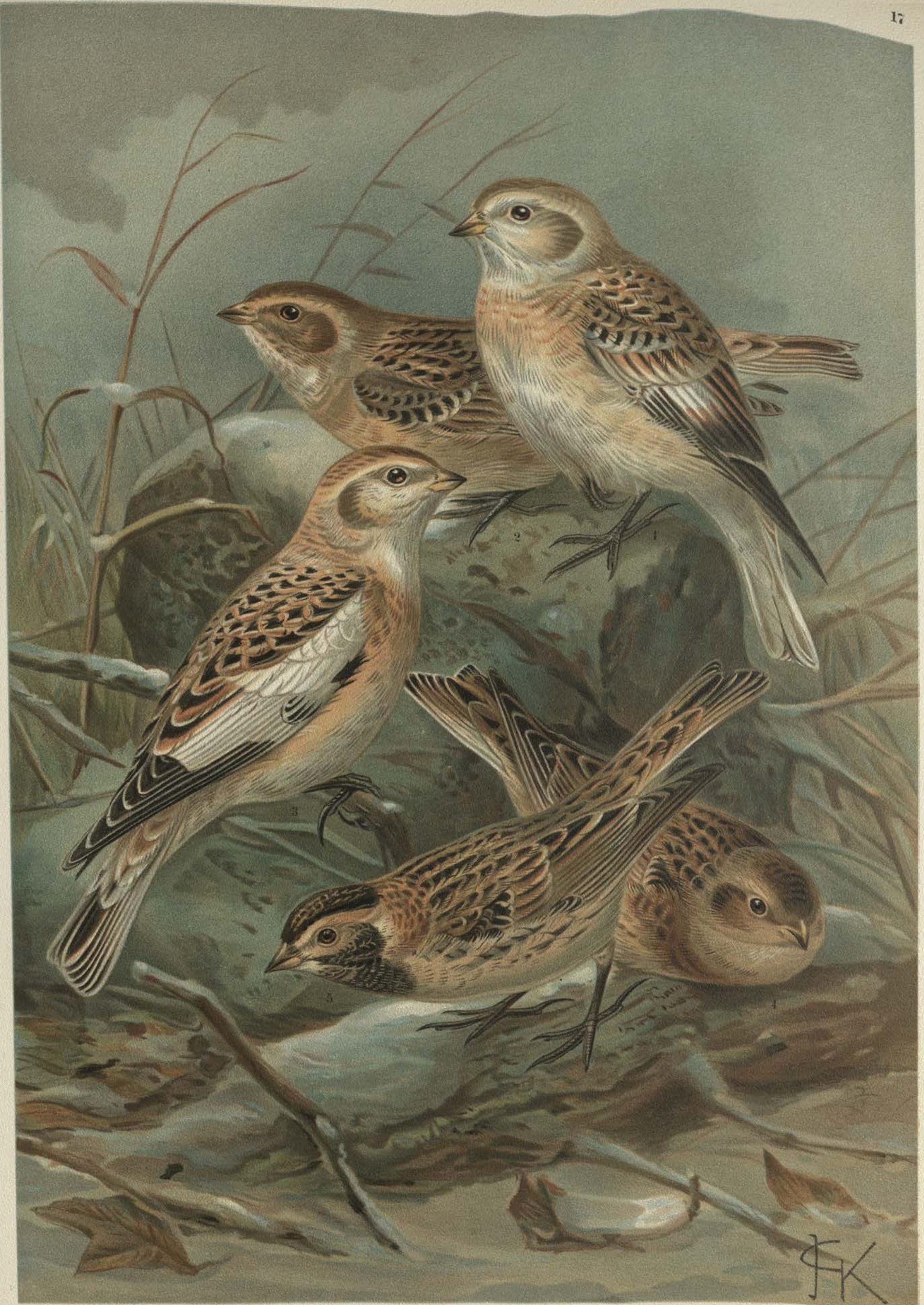
Plectrophenax nivalis (L.). Schneeammer.

1 altes Weibchen, 2 junges Männchen, 3 altes Männchen, 4 junges Weibchen.