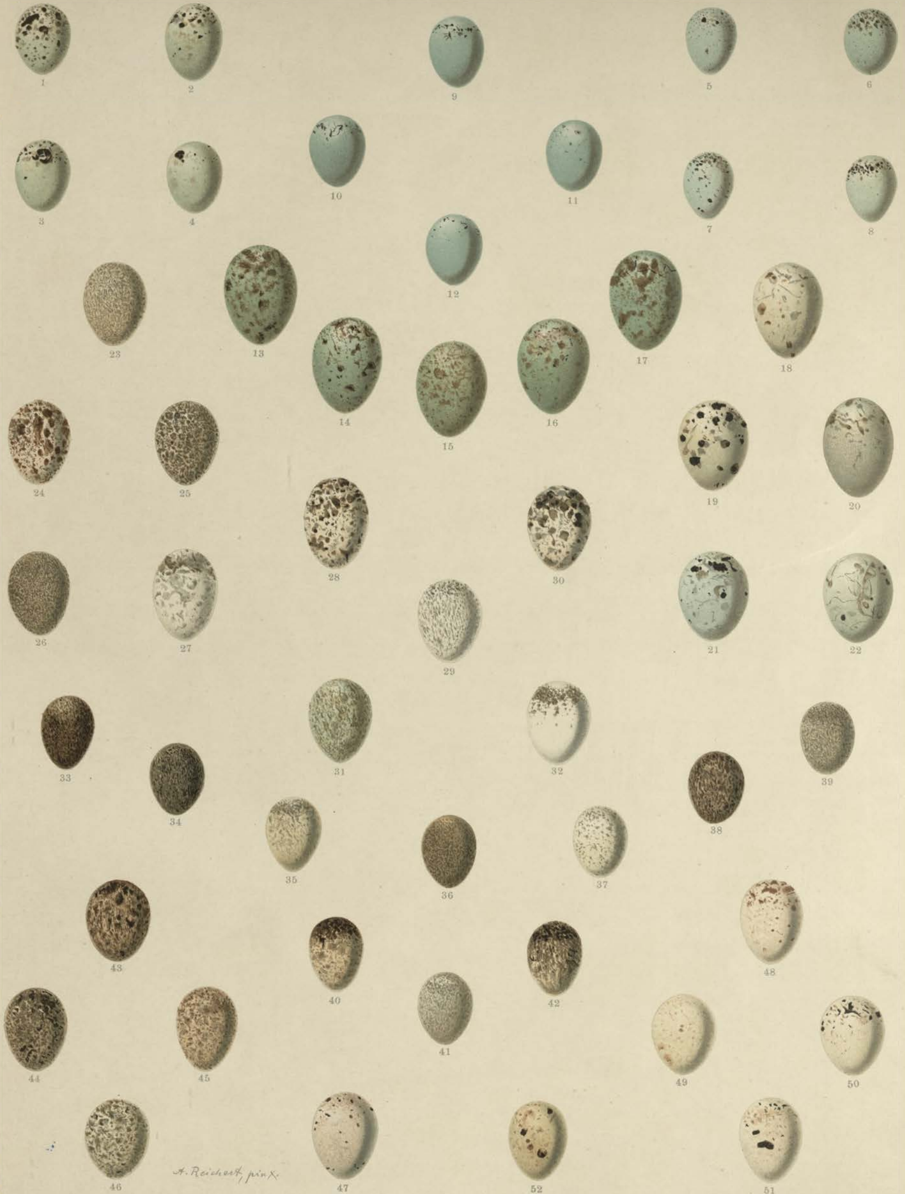
1—4 Pyrrhula pyrrhula (L.) typica, Grosser Gimpel; 5—8 Pyrrhula pyrrhula europaea (Vieill.), Kleiner Gimpel; 9—12 Carpodacus erythrinus (Pall.), Karmingimpel; 13—17 Pinicola enucleator (L.), Fichtengimpel; 18—22 Coccothraustes coccothraustes (L.), Kirschkernebeisser; 23—32 Passer domesticus (L.), Haussperling; 33—42 Passer montanus (L.), Feldsperling; 43—46 Passer petronius (L.), Steinsperling; 47 Loxia pityopsittacus Bechst., Kiefern-Kreuzschnabel; 48—51 Loxia curvirostra L., Fichten-Kreuzschnabel; 52 Loxia bifasciata Brehm, Zweibindiger Kreuzschnabel.