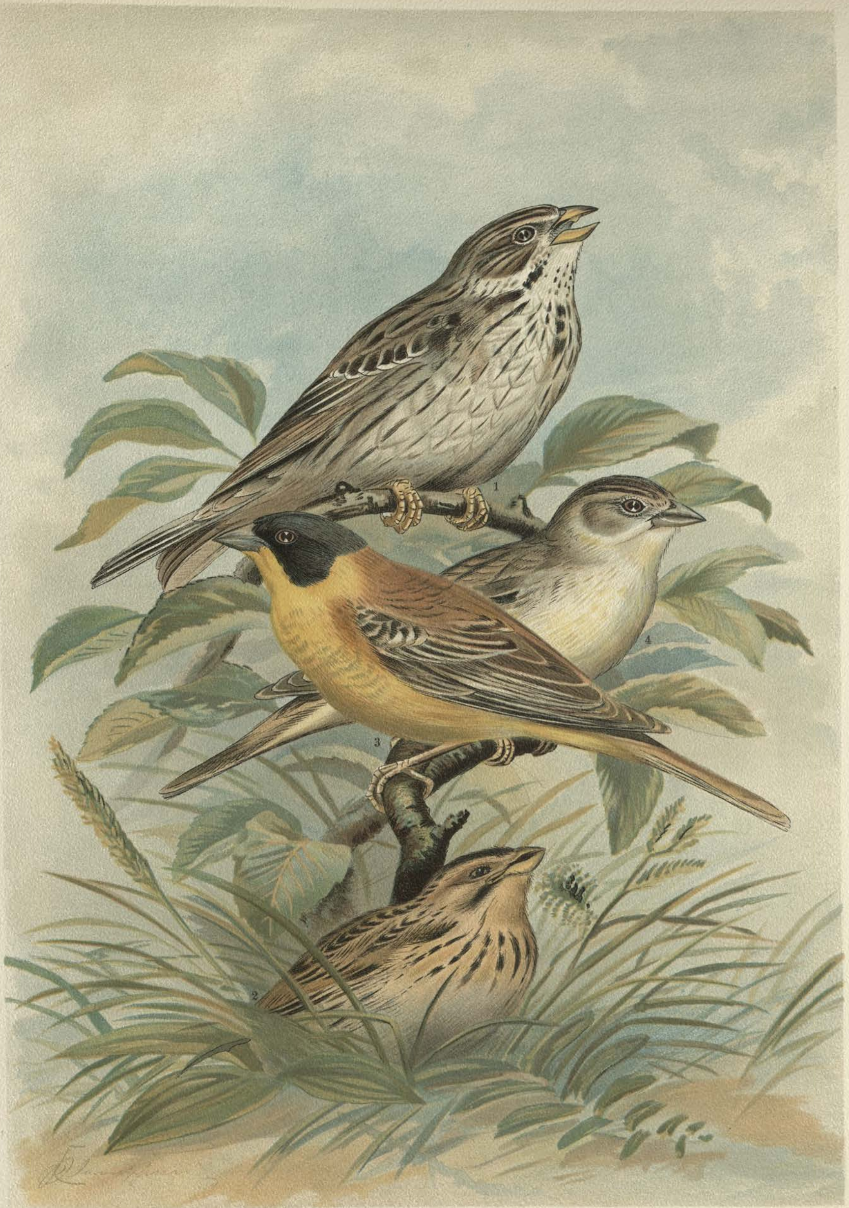
Miliaria calandra (L.). Grauammer. 1 altes Männchen, 2 Männchen im Nestkleide. Emberiza melanocephala Scopoli. Kappenammer. 3 Männchen, 4 Weibchen.