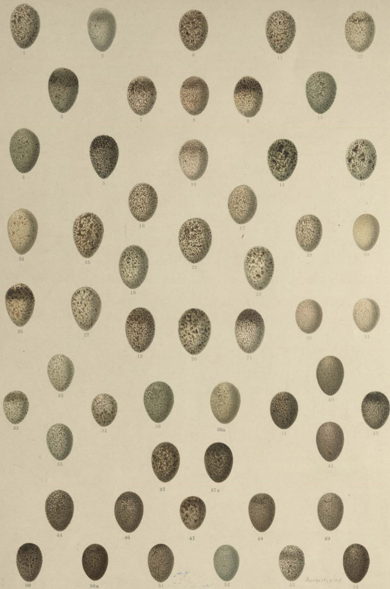
1—5 Alauda arvensis L., Europäische Feldlerche; 6—10 Lullula arborea (L.), Heide-Lerche; 11—15 Galerida cristata (L.), Hauben-Lerche; 16—17 Galerida theklae Brehm, Theklas Haubenlerche; 18—22 Melanocorypha calandra (L.), Kalandler-Lerche; 23. Melanocorypha yeltoniensis (Forst.), Mohren-Lerche; 24—27 Melanocorypha sibirica (Gm.), Weissflügel-Lerche; 28—31 Calandrella brachydactyla (Leisl.), Kurzzeilige Lerche; 32—35 Calandrella pispoletta (Pall.), Stummel-Lerche; 36—37a Otocorys alpestris (L.), Alpen-Lerche; 40—43 Anthus spipoletta (L.), Wasser-Pieper; 44—46 Anthus obscurus (Lath.), Strand-Pieper; 47—49 Anthus pensilvanicus (Lath.), Nordamerikanischer Wasser-Pieper; 50—54 Anthus pratensis (L.), Wiesen-Pieper.