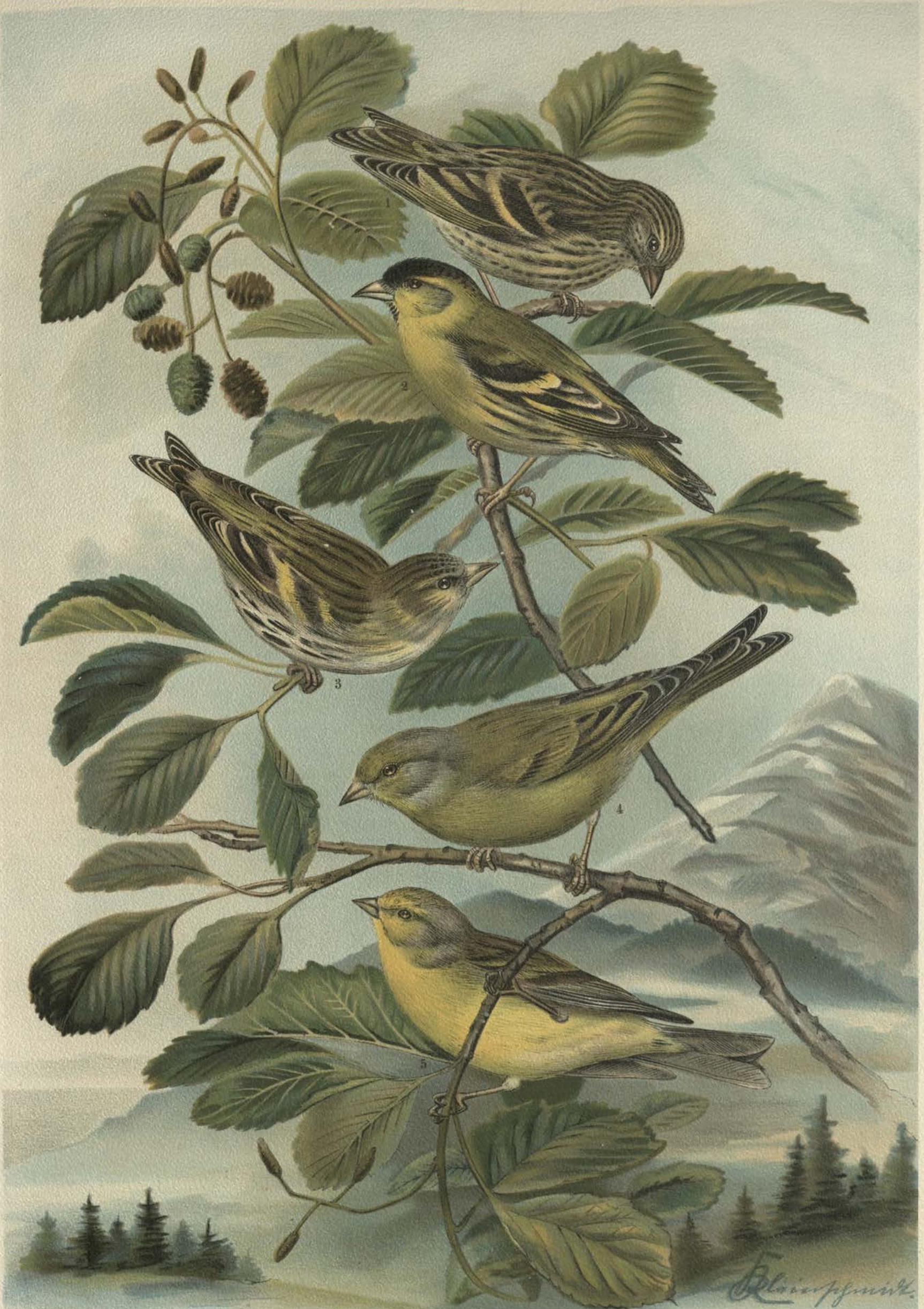
Chrysomitris spinus (L.). Erlenzeisig. Chrysomitris citrinella (L.). Zitronenzeisig. 1 junges Männchen, 2 altes Männchen, 3 altes Weibchen. 4 Männchen.

Chrysomitris corsicanus (König). Korsikanischer Zitronenzeisig. 5 Männchen.