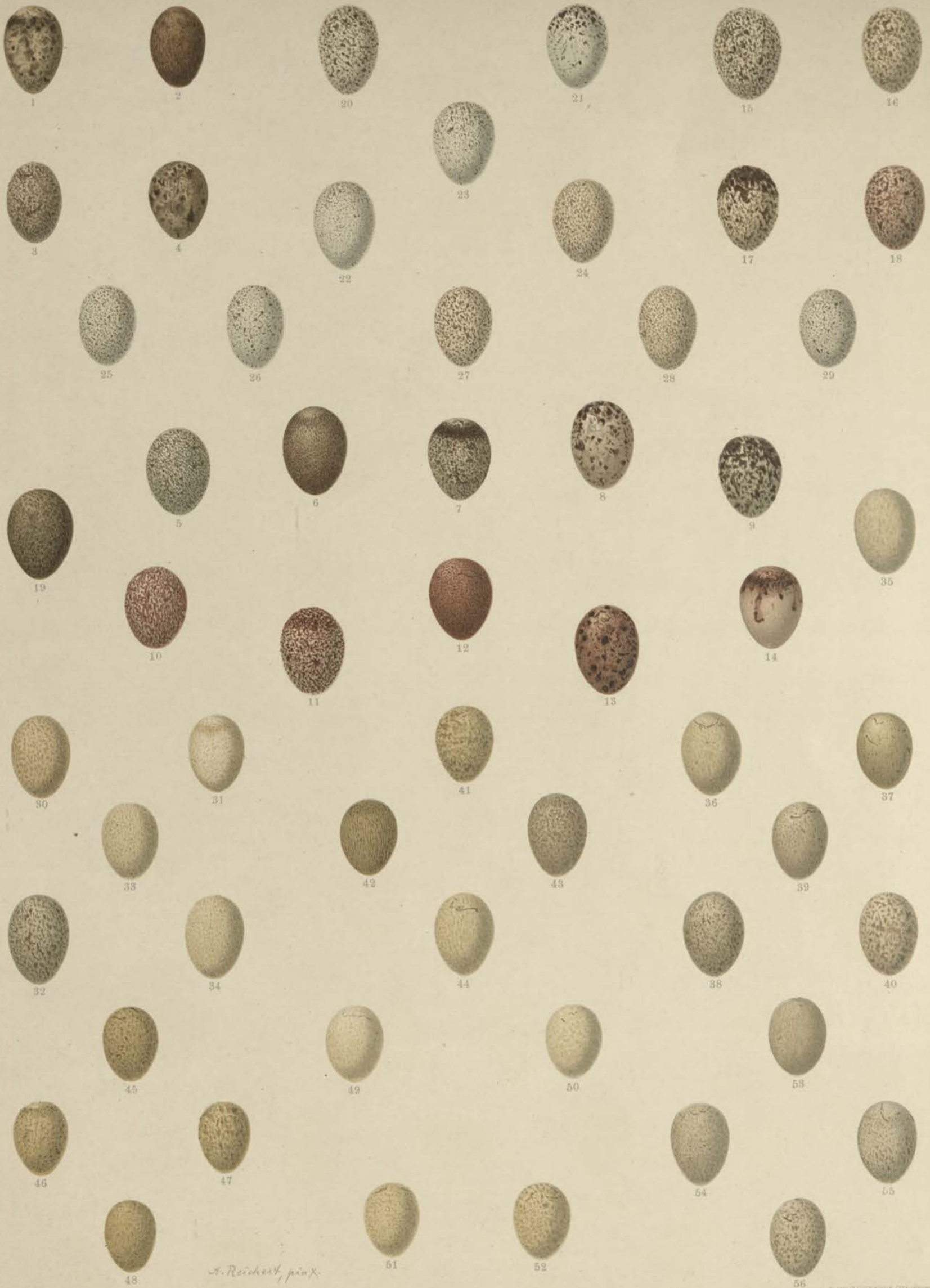
1—4 Anthus cervinus (Pall.), Rotkehliger Wiesenpieper; 5—14 Anthus trivialis (L.), Baumpieper; 15—18 Anthus campestris (L.), Brachpieper; 19 Anthus Richardi Vieillot, Spornpieper; 20—24 Motacilla alba L., Weisse Bachstelze; 25—29 Motacilla lugubris Temm., Schwarze Bachstelze; 30—34 Motacilla boarula L., Graue Bachstelze; 35 Budytes citreolus (Pall.), Gelbköpfige Bachstelze; 36—40 Budytes flavus (L.), Gelbe Bachstelze; 41—44 Budytes flavus borealis (Sundevall), Nordische Schafstelze; 45—48 Budytes campestris (Pall.), Gelbstirnige Bachstelze; 49—52 Budytes flavus cinereocapillus (Savi.), Grauköpfige Schafstelze; 53—56 Budytes melanocephalus (Lichtenstein), Schwarzköpfige Schafstelze.