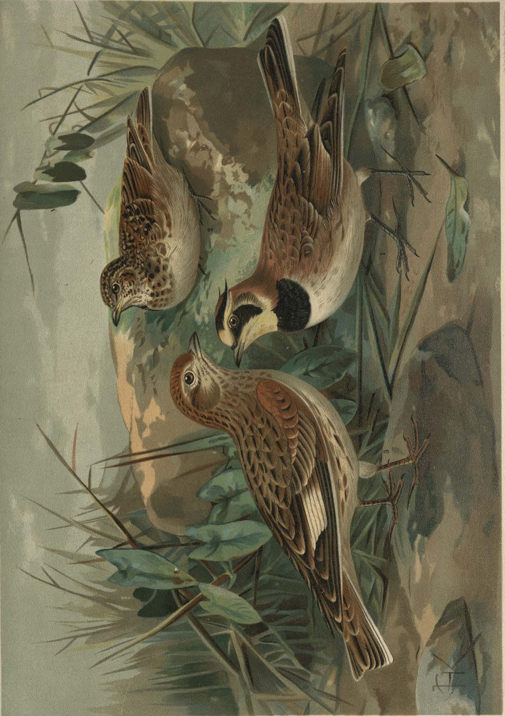
Otocorys alpestris (L.). Berglerche. 1 altes Männchen. 2 junger Vogel. Melanocorypha sibirica (Gm.). Weissflügellерche. 3 Männchen. Natürl. Grösse.