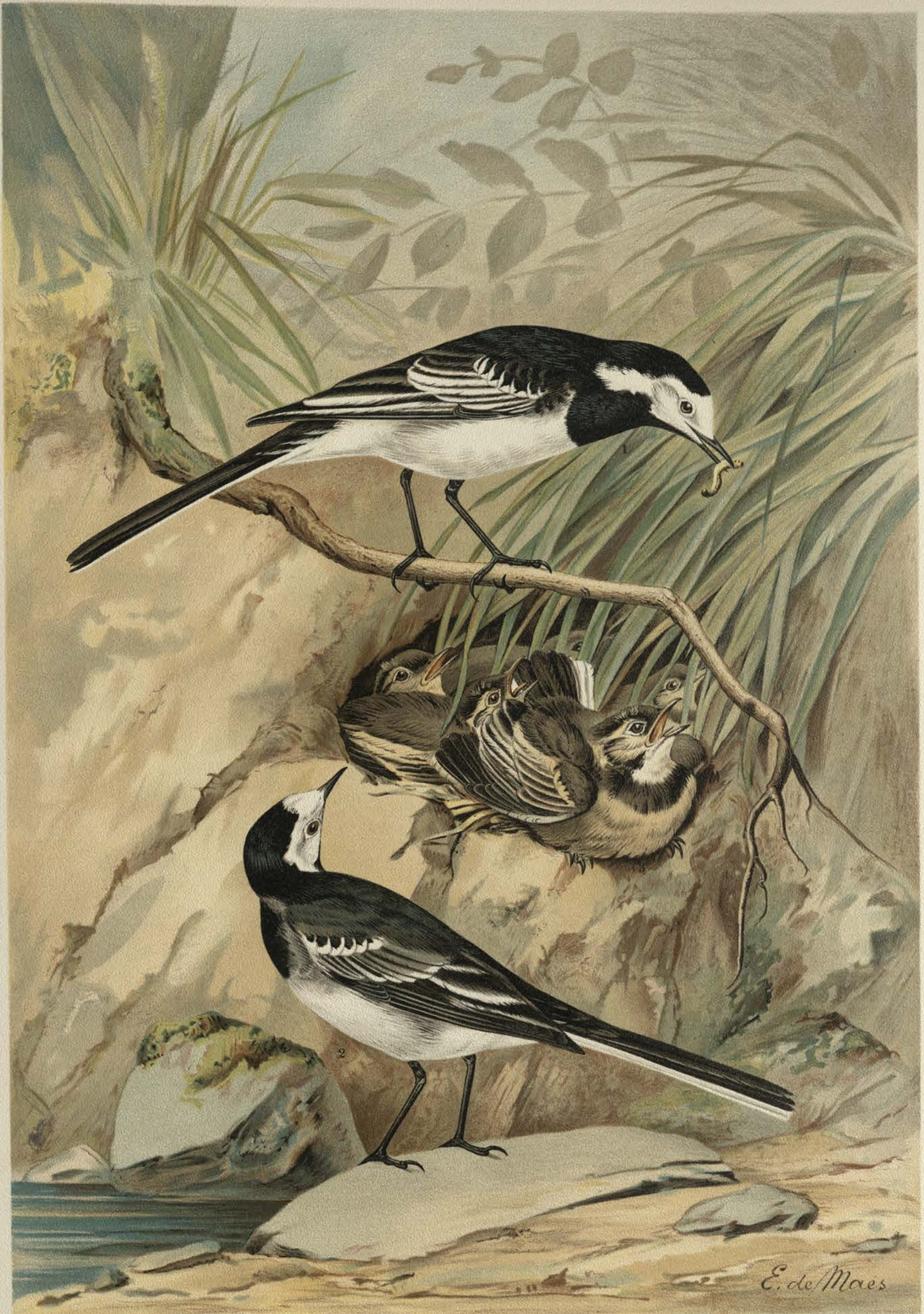
Motacilla lugubris Temm. Schwarze Bachstelze.

1 altes Männchen. 2 altes Weibchen. 3 junger Vogel. (Sommerkleider.)