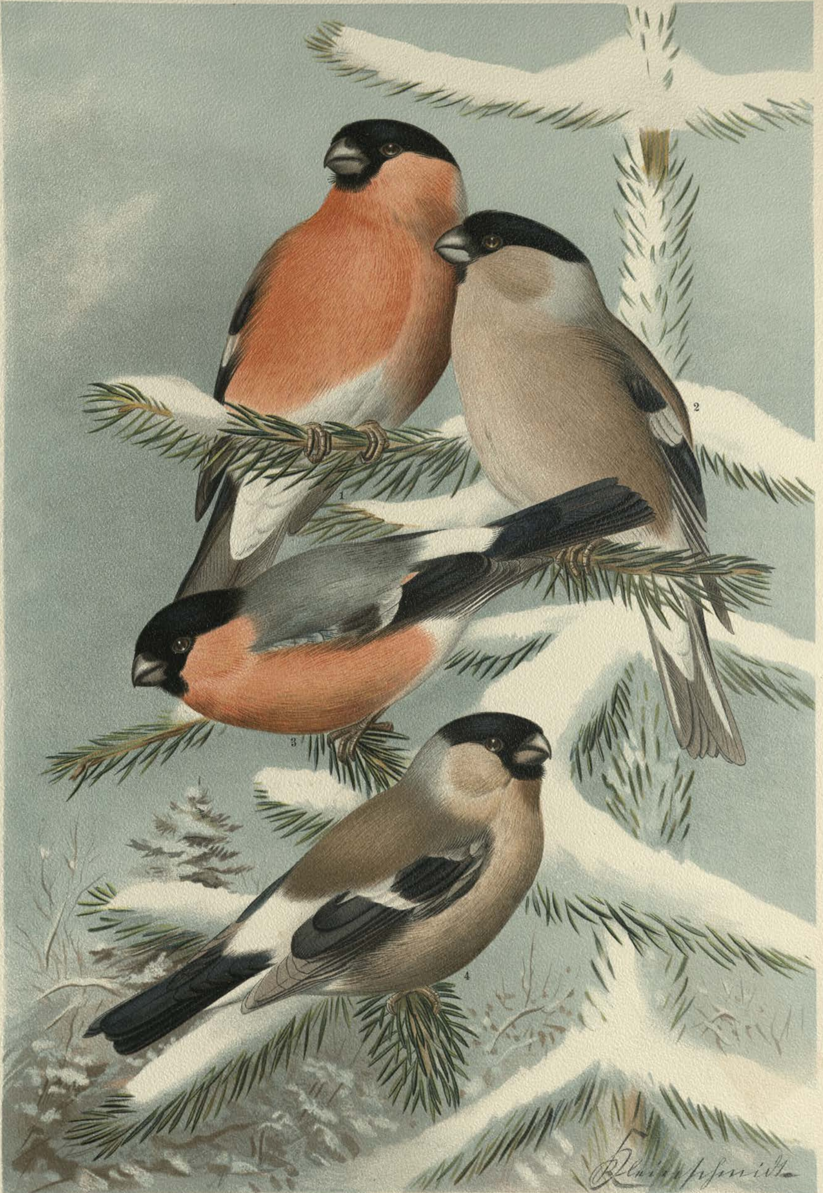
Pyrrhula pyrrhula (L.). Grosser Gimpel. 1 Männchen, 2 Weibchen.