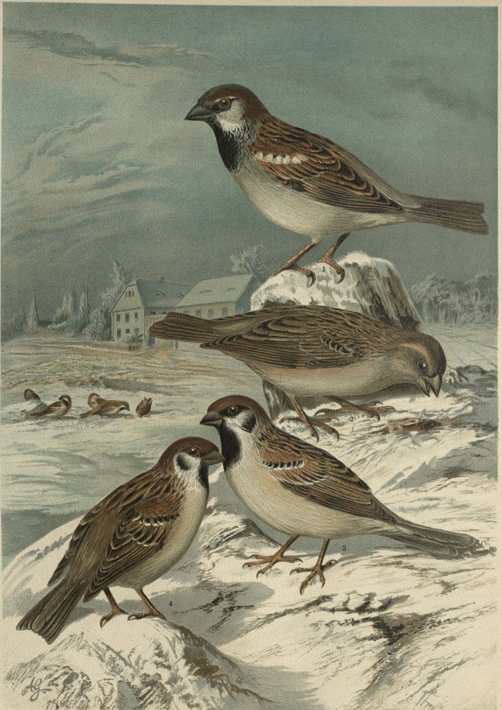
Passer domesticus (L.). Haussperling. 1 Männchen. 2 Weibchen. Passer montanus (L.). Feldsperling. 3 Männchen. 4 Weibchen. Natürl. Grösse.