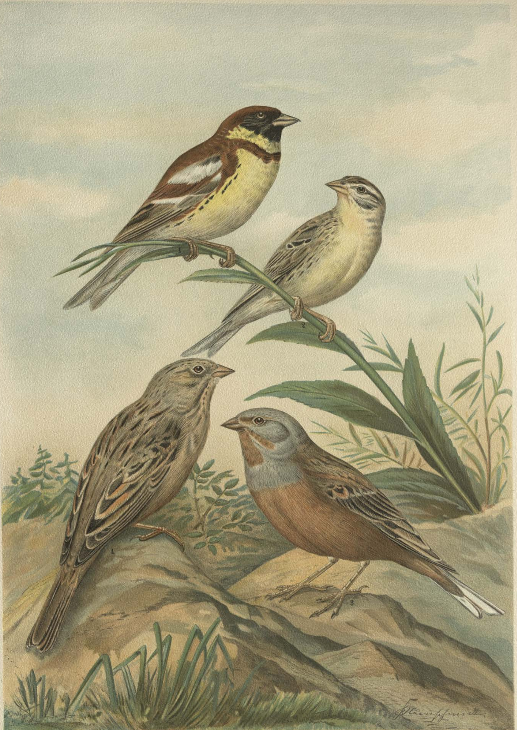
Emberiza aureola Pall. Weidenammer. 1 Männchen. 2 Weibchen. Emberiza caesia Cretschmar. Grauer Ortolan. 3 Männchen. 4 Weibchen.