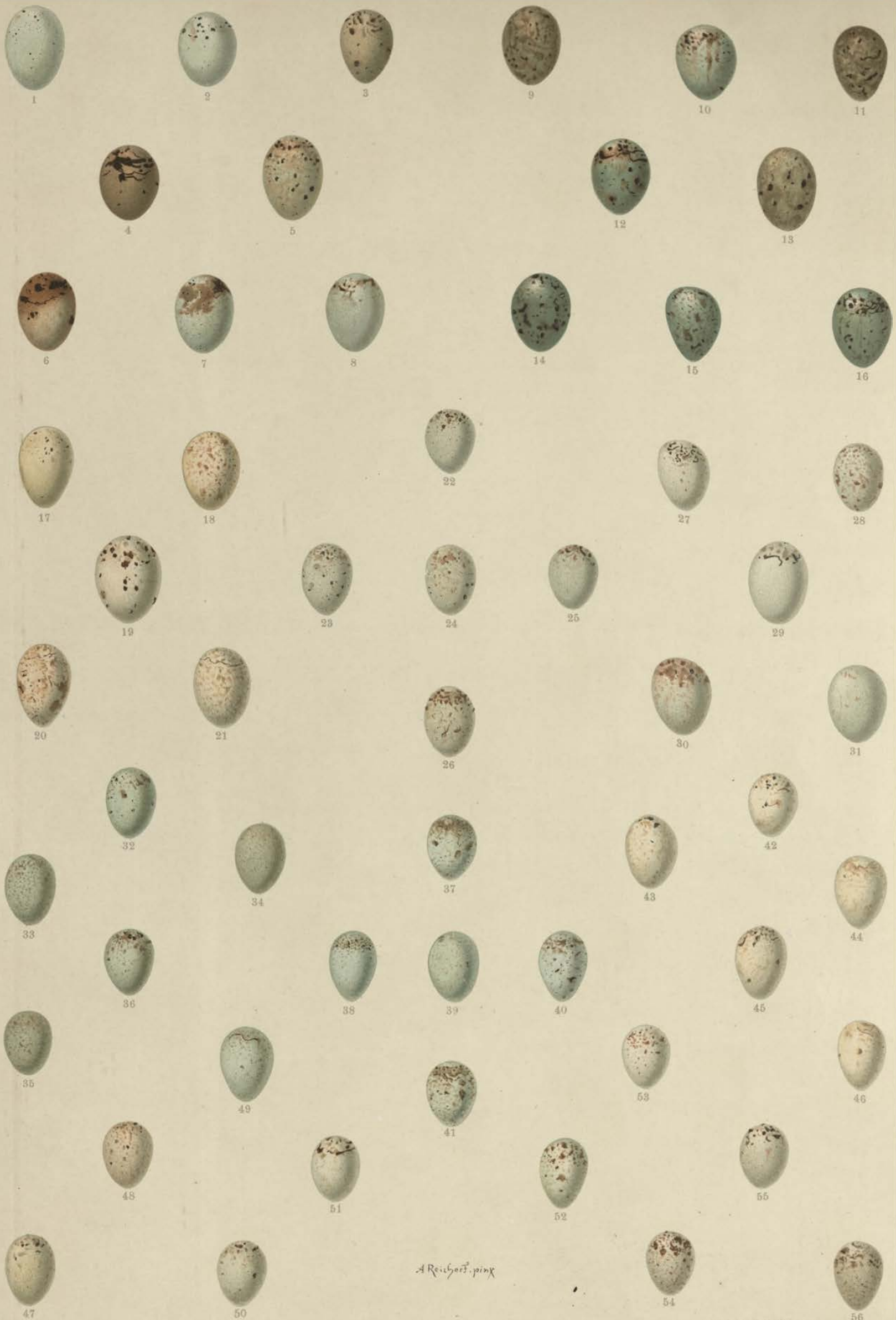
1—8 F. coelebs L., Buch-Fink; 9—16 F. montifringilla L., Bergfink; 17—21 Ch. chloris (L.), Grünling; 22—26 Ch. citrinella (L.), Citronen-Zeisig; 27—31 A. cannabina (L.), Blut-Hänfling; 32—36 A. flavirostris (L.), Berg- Hänfling; 37—41 A. linaria (L.), Birken-Zeisig; 42—46 C. carduelis (L.), Distel-Zeisig; 47—51 Ch. spinus (L.), Erlen-Zeisig; 52—56 S. serinus (L.), Girlitz.