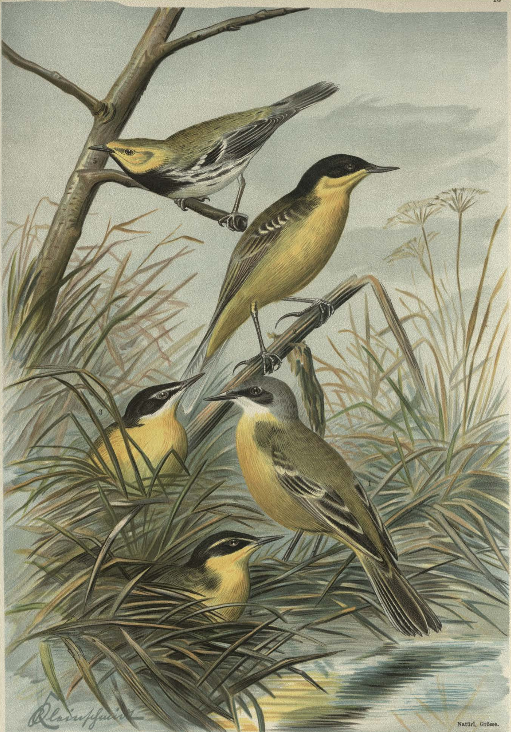
Budytes flavus cinereocapillus (Savi). Grauköpfige Schafstelze. 1 altes Männchen im Frühling. Budytes melanocephalus (Lichtenstein). Schwarzköpfige Schafstelze. 2 altes Männchen im Frühling. Budytes melanocephalus paradoxus (Brehm). Weisszügelige Schafstelze. 3 altes Männchen im Frühling. Budytes melanocephalus xanthophrys (Sharpe). Gelbbraunige Schafstelze. 4 altes Männchen im Frühling. Dendroeca virens (Gm.). Grüner Waldsänger. 5 Männchen.