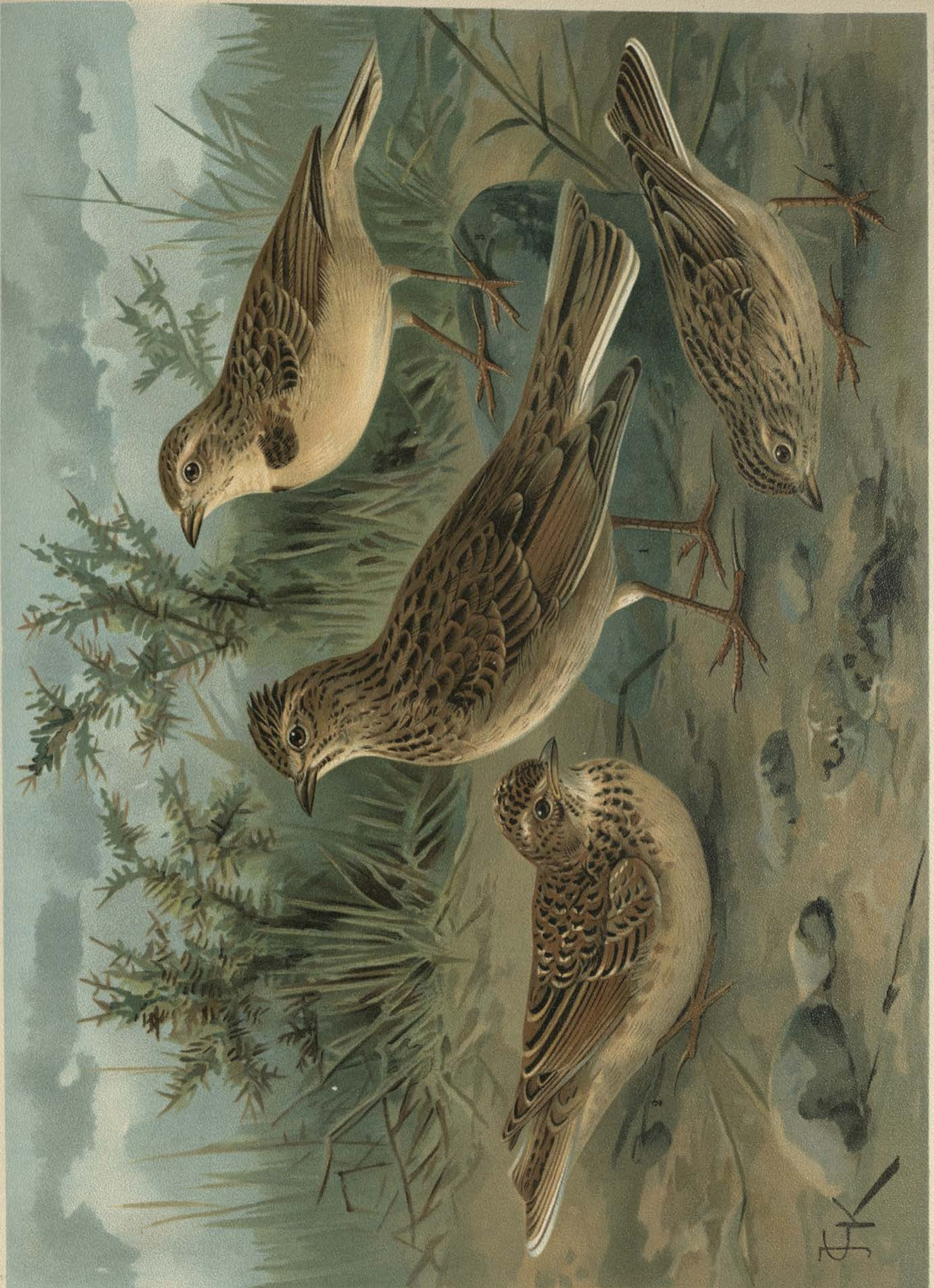
Alauda arvensis L. Feldlerche. 1 altes Männchen. 2 junger Vogel. 3 Calandrella brachydactyla (Leisl.). Kurzzeilige Lerche. Männchen.