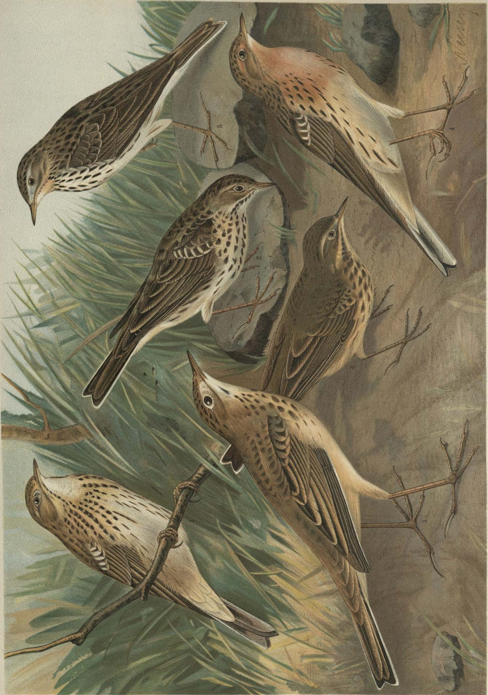
Anthus trivialis (L.). Baumpieper. 1 Männchen. Anthus cervinus (Pall.). Rotkehliger Wiesenpieper. 4 Männchen, 5 Weibchen. Anthus pratensis (L.). Wiesenpieper. 2 Männchen. Anthus pensilvanicus (Lath.). Nordamerikanischer Wasserpieper. 6 Männchen. Anthus richardi Vieillot. Spornpieper. 3 Männchen. Alle in Sommerkleidern.