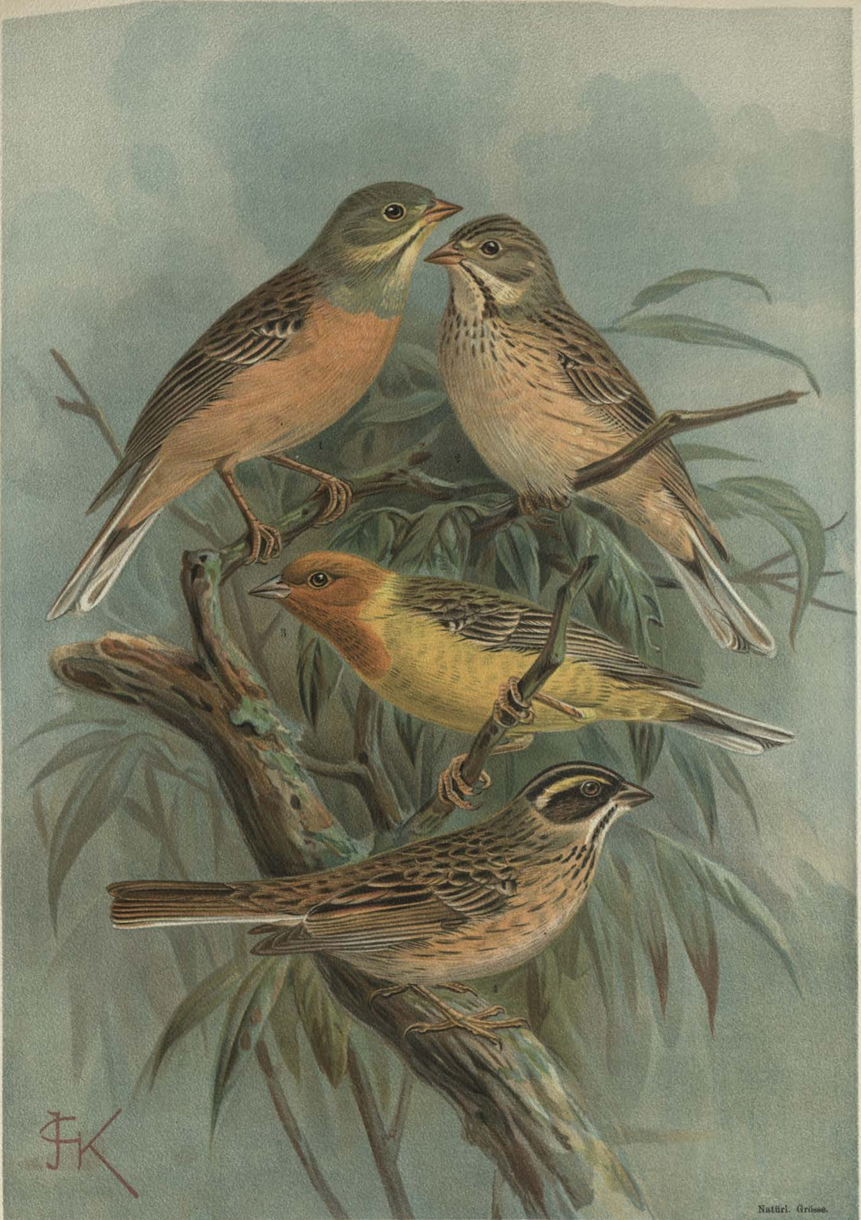
Emberiza hortulana L. Gartenammer. Emberiza luteola Sparrm. Braunkehliger Ammer. 1 Männchen, 2 Weibchen. 3 Männchen.