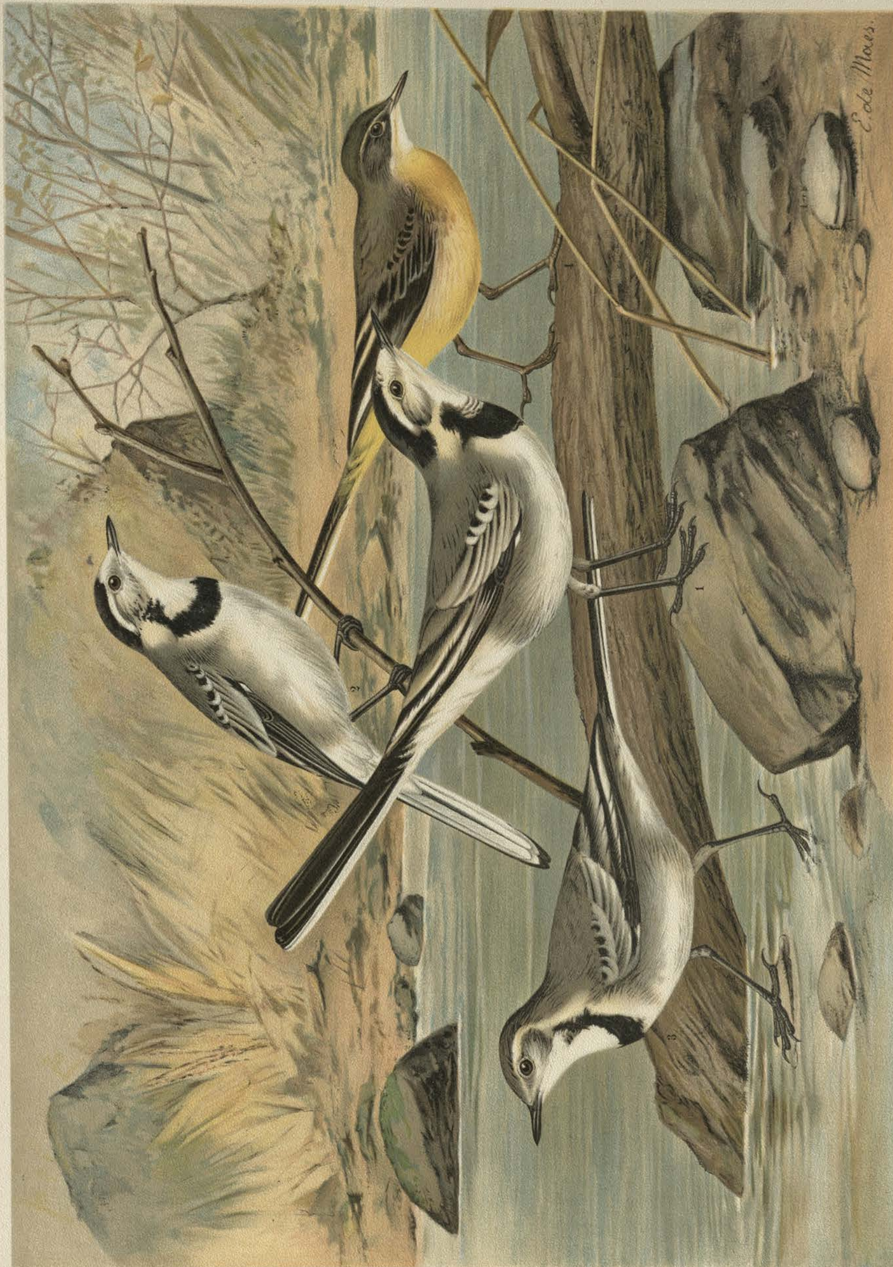
Motacilla alba L. Weisse Bachstelze. 1 Männchen, 2 Weibchen, 3 Weibchen im zweiten Jugendkleide.