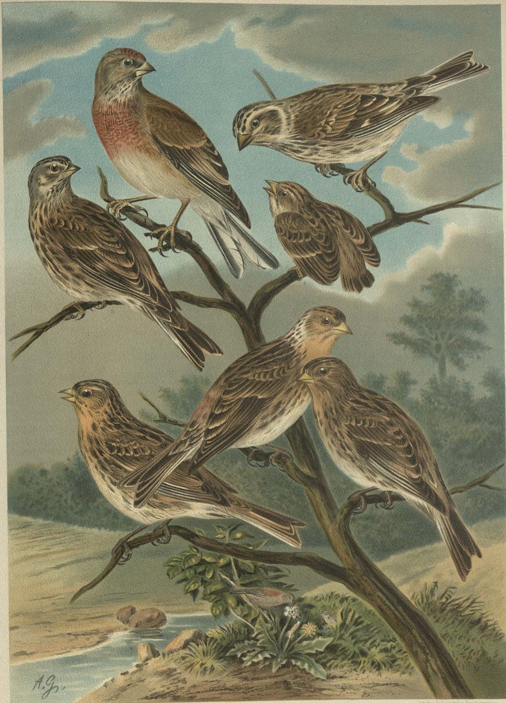
Acanthis cannabina (L.) Bluthänfling. 1 Männchen. 2 Weibchen. 3 und 4 junge Vögel. Acanthis flavirostris (L.) Berghänfling. 5 Männchen. 6 Weibchen. 7 junges Männchen.