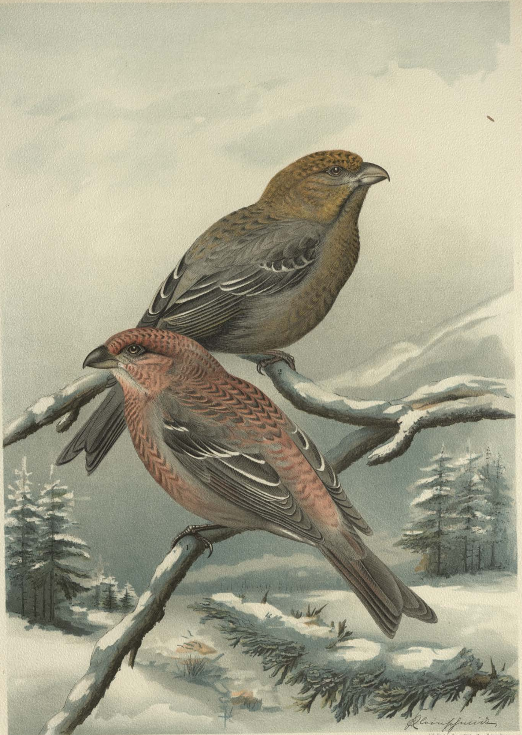
Pinicola enucleator (L.). Hakengimpel. 1 Männchen. 2 Weibchen. Natürl. Grösse.