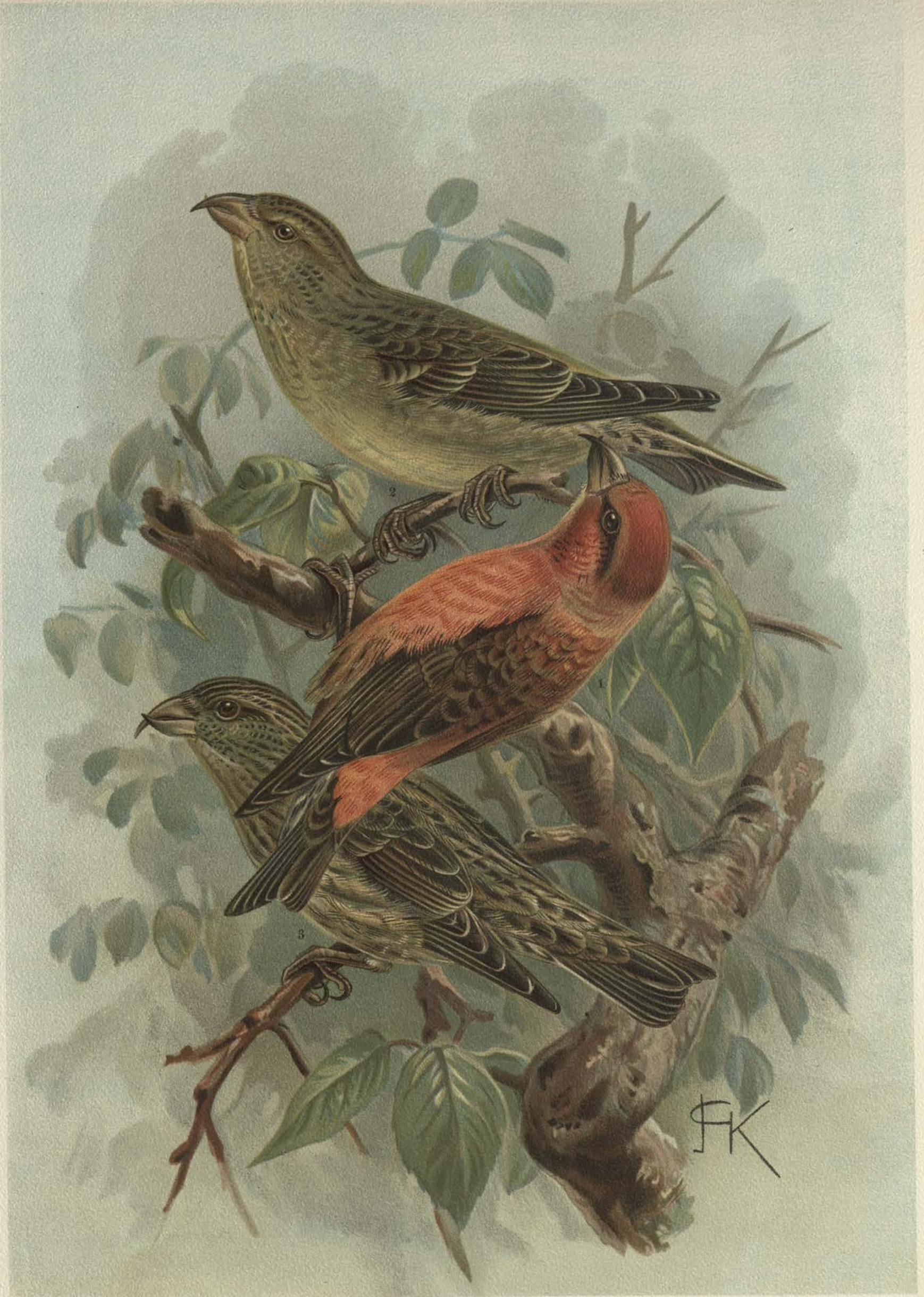
Loxia curvirostra L. Fichtenkreuzschnabel. 1 Männchen, 2 Weibchen, 3 junger Vogel.