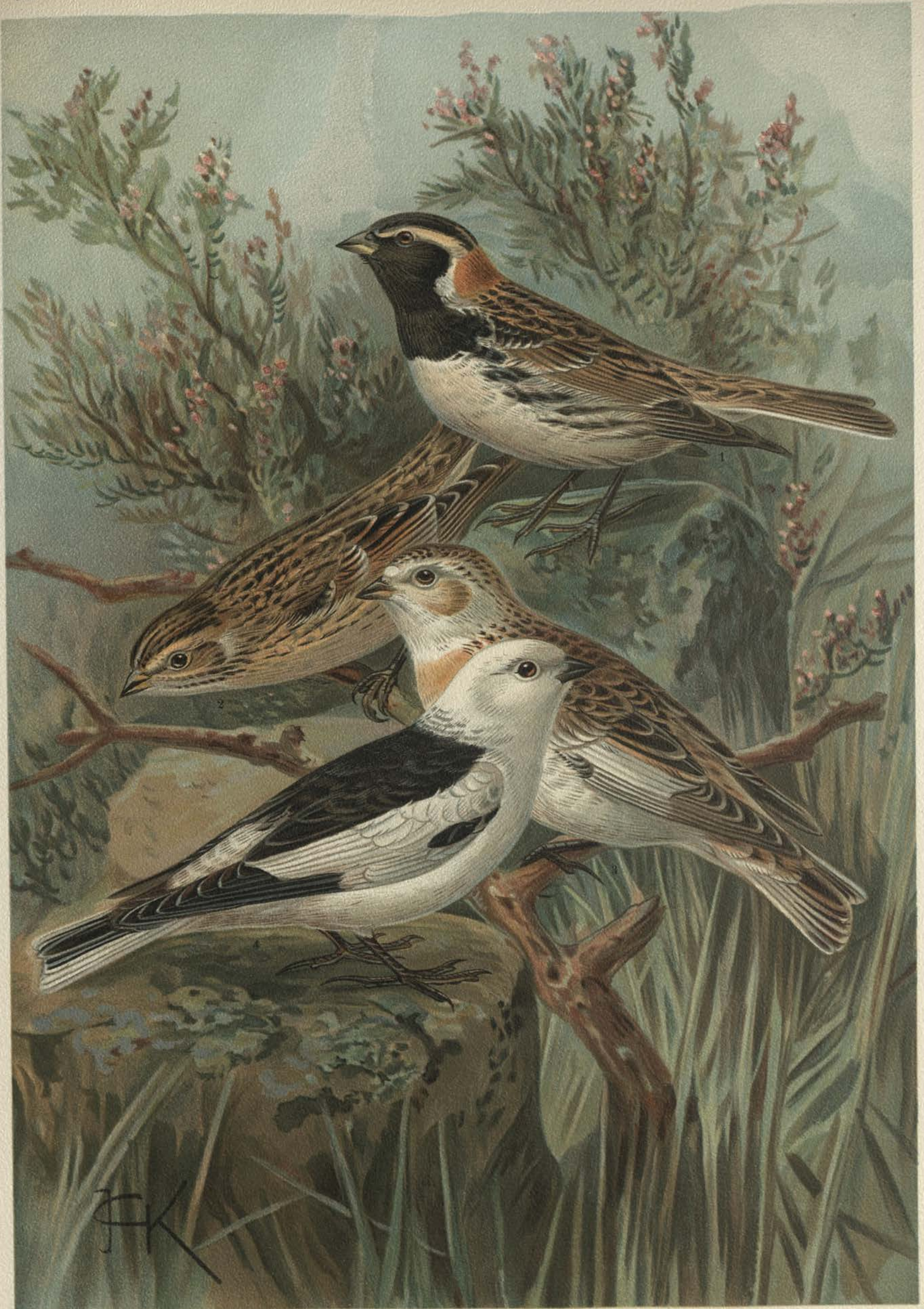
Calcarius lapponicus (L.), Lerchenspornammer. 1 altes Männchen, 2 junges Weibchen.