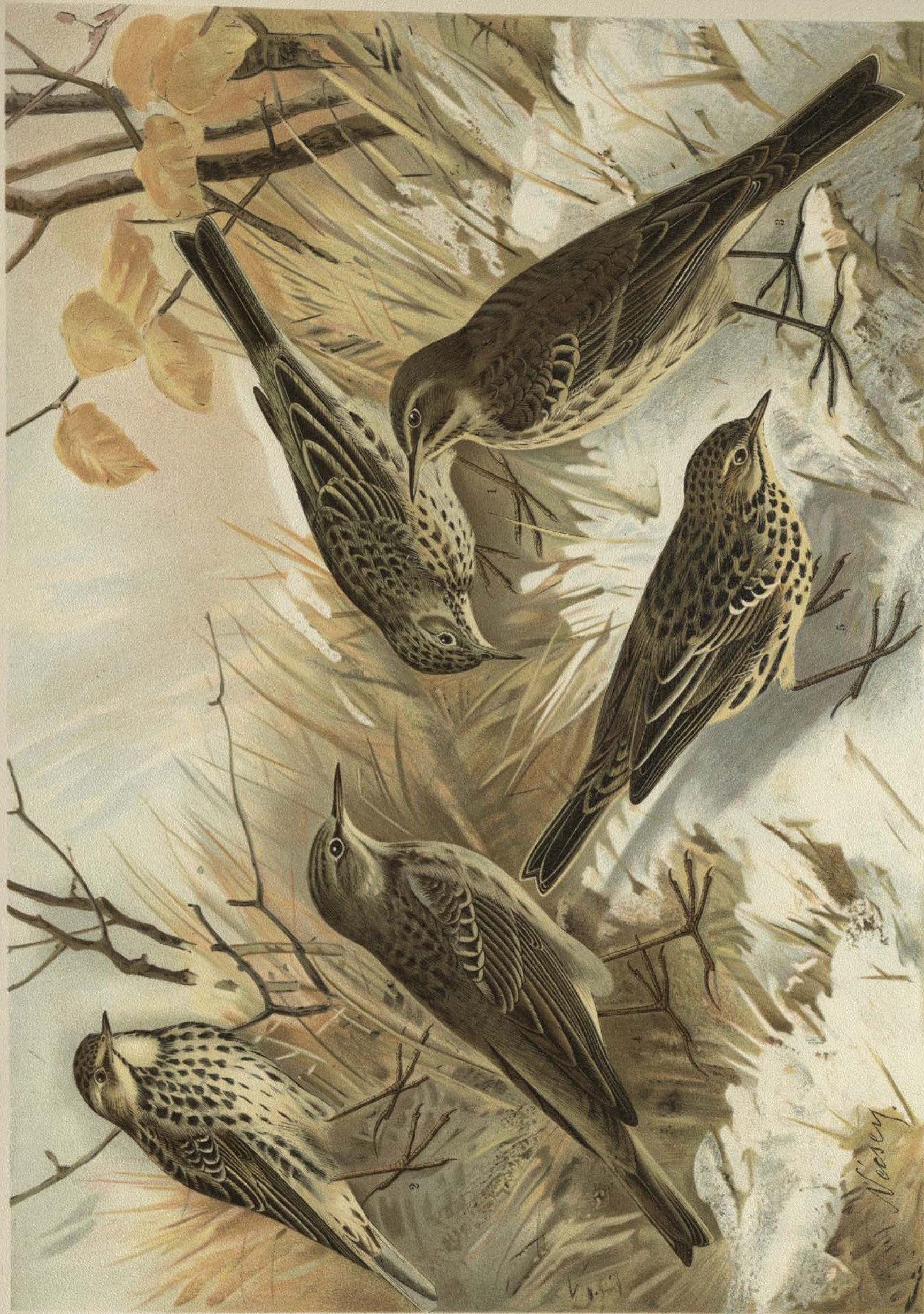
Anthus pratensis (L.), Wiesenpieper. 1 Männchen. Anthus cervinus (Pall.), Rotkehliger Wiesenpieper. 2 und 5 Männchen.