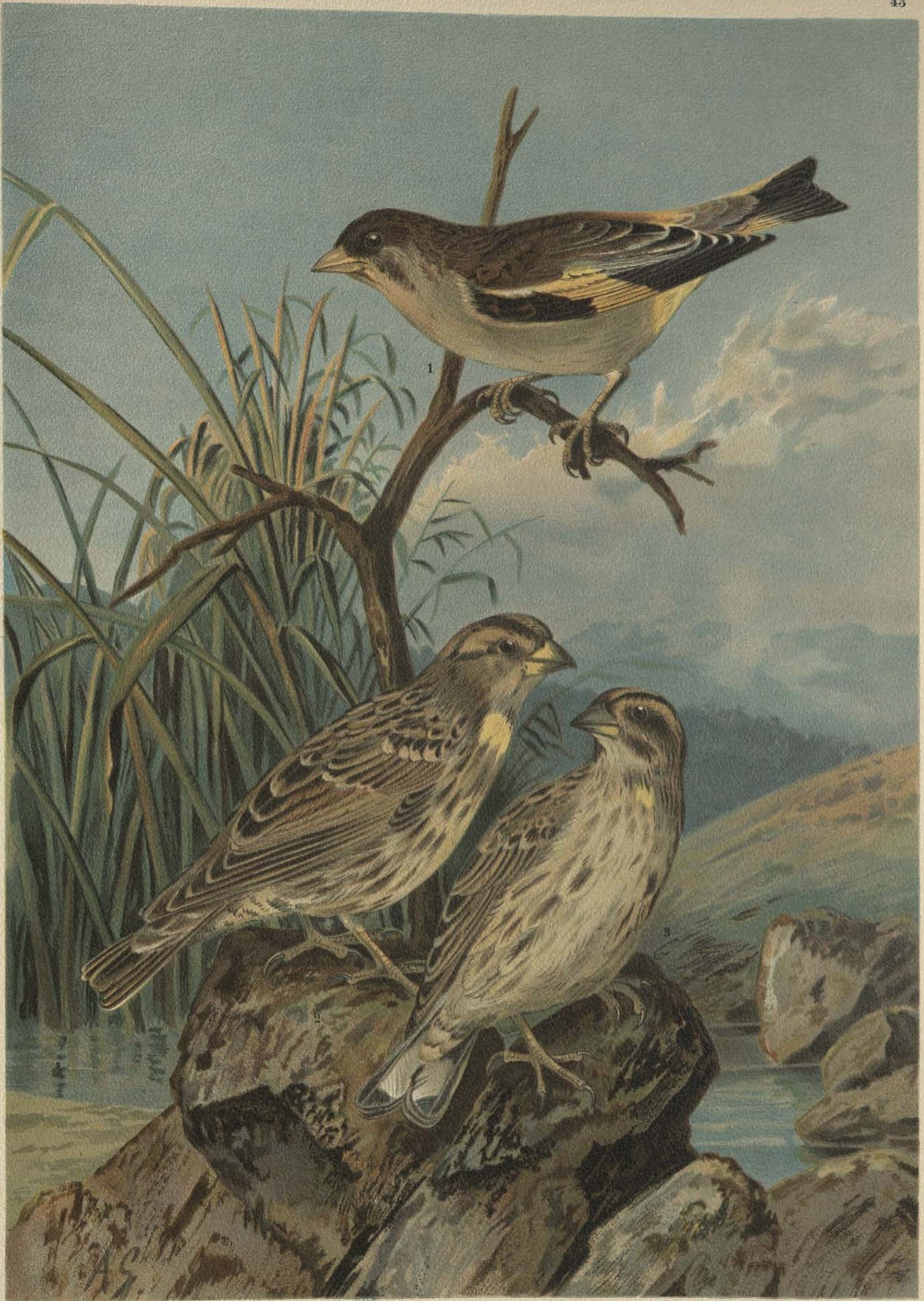
Chloris sinica (L.). Sibirischer Grünling. 1 junges Männchen. Passer petronius (L.). Steinsperling. 2 Männchen. 3 Weibchen. Natürl. Grösse.