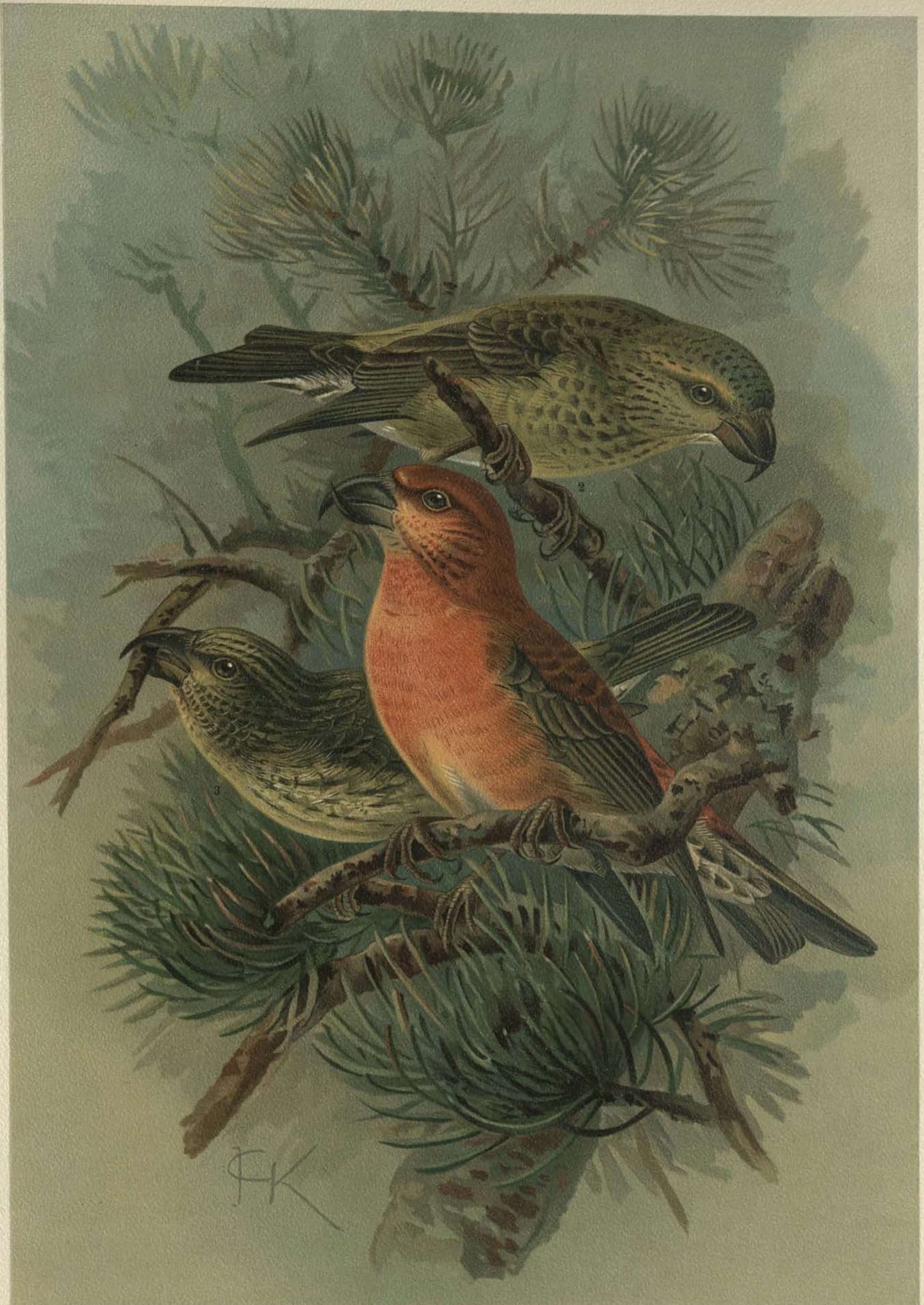
Loxia pityopsittacus Bechst. Kiefernkreuzschnabel. 1 Männchen. 2 Weibchen. 3 Junger Vogel.