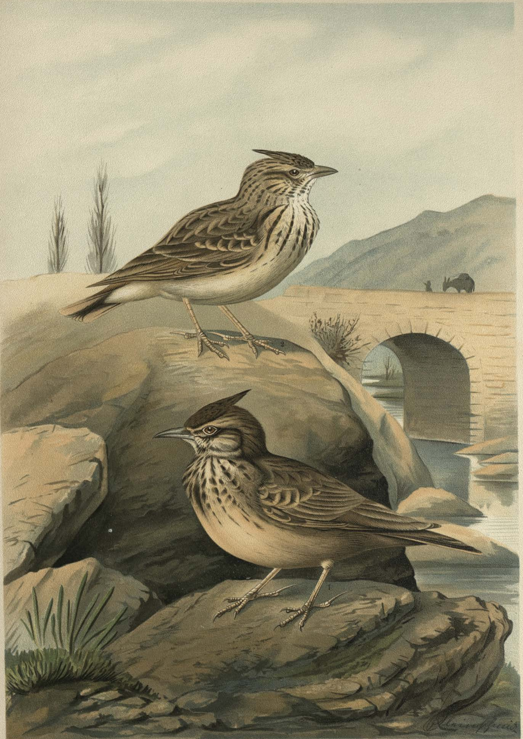
1 Galerida cristata (L.). Haubenlerche. Männchen.