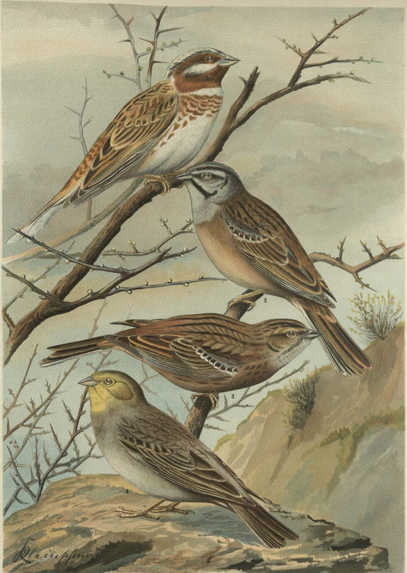
Emberiza leucocephala Gmel. Fichtenammer. 1 Männchen. Emberiza cia L., Zipammer. 2 Männchen. 3 Weibchen.