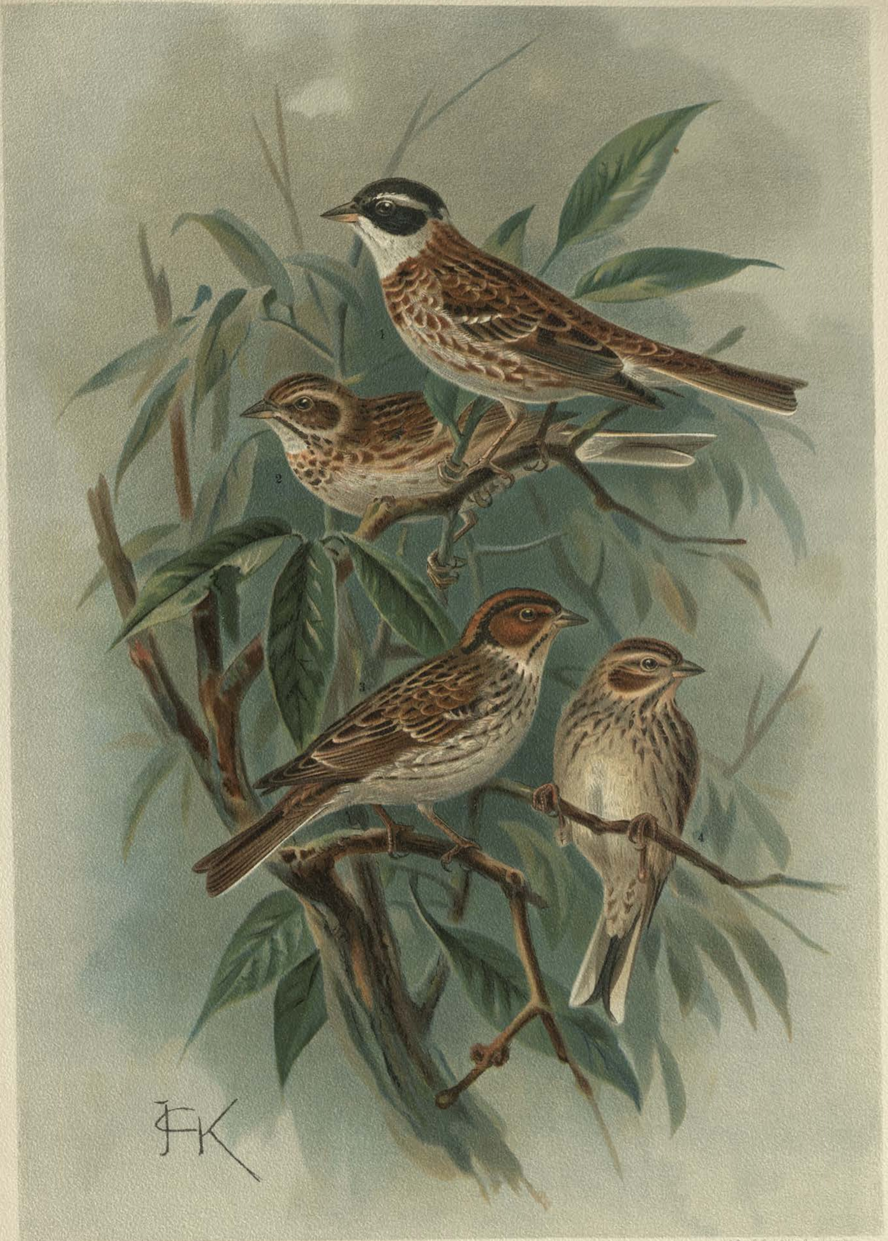
Emberiza rustica Pall. Waldammer. 1 Männchen. 2 Weibchen. Emberiza pusilla Pall. Zwergammer. 3 Männchen. 4 Weibchen. Natürl. Grösse.