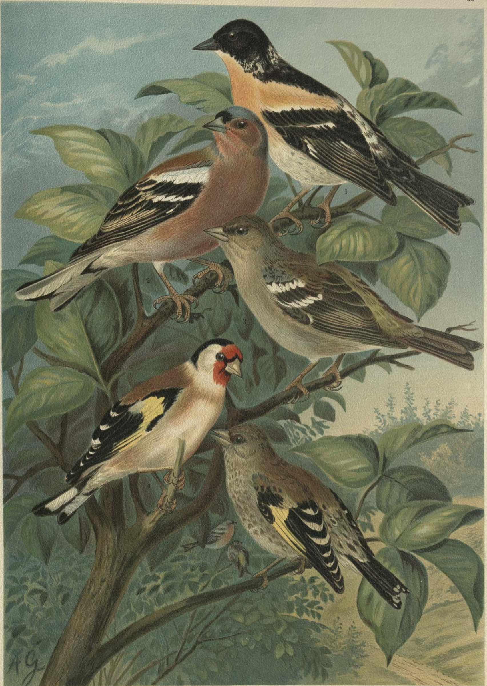
Fringilla montifringilla L. Bergfink. 1 Männchen im Sommer.