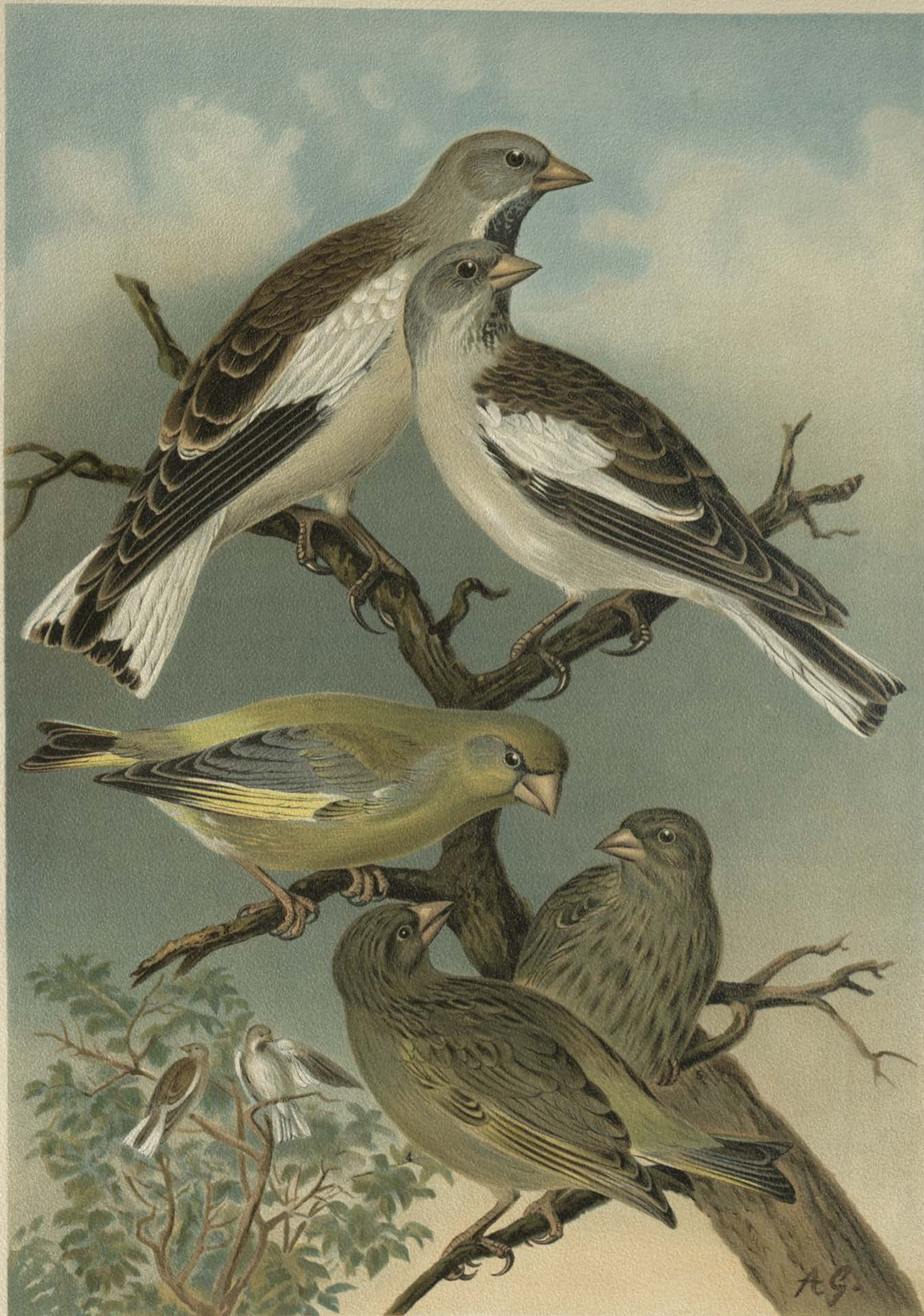
Fringilla nivalis L. Schneefink. 1 Männchen. 2 Weibchen. Chloris chloris (L.). Grünfink. 3 Männchen. 4 Weibchen. 5 junger Vogel.