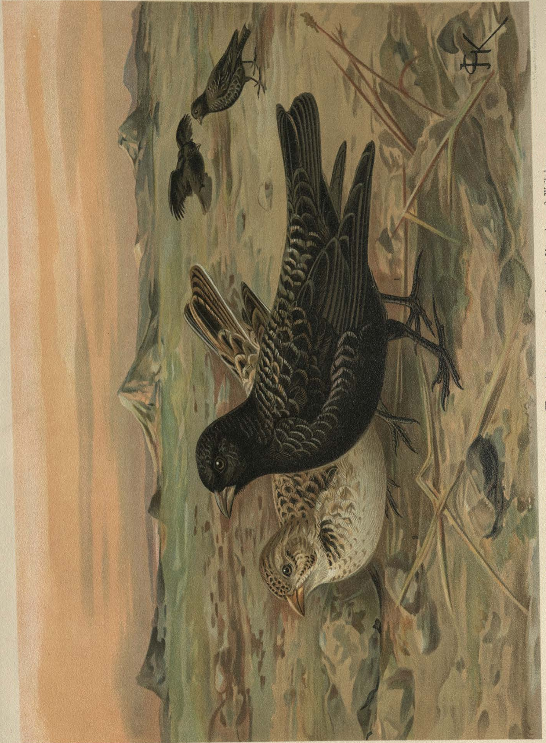
Melanocorypha yeltoniensis (Forst.). Möhrenlerche. 1 Männchen. 2 Weibchen. Natürl. Grösse.