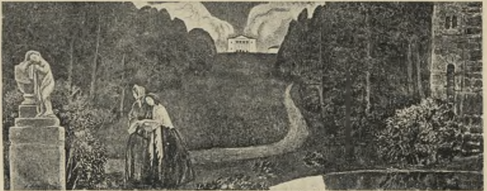
Сонъ божества. (Эскизь для фресокъ).