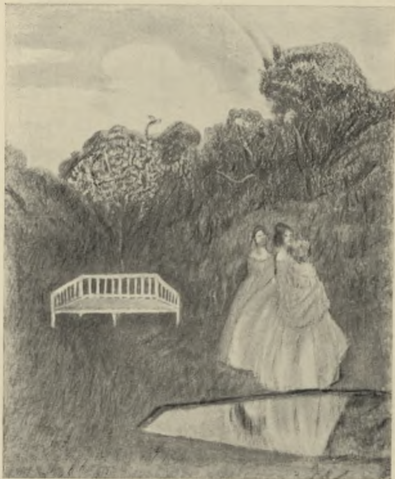
Паркъ погружається въ тѣнь.