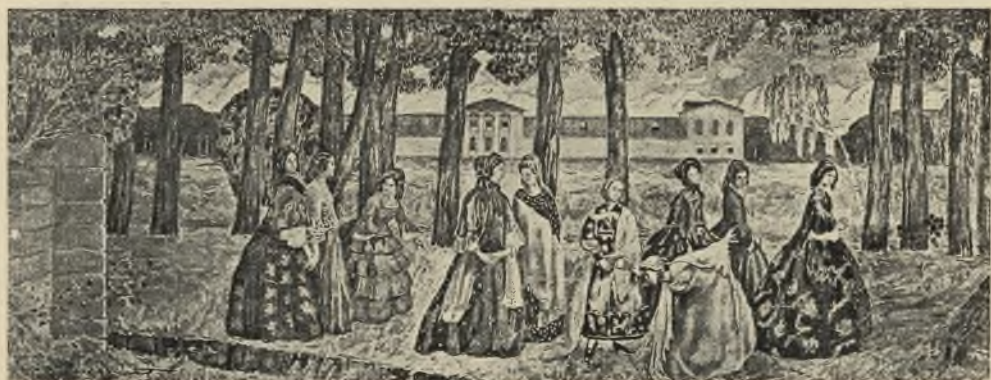
Осенний вечер. (Эскиз для фресокъ).