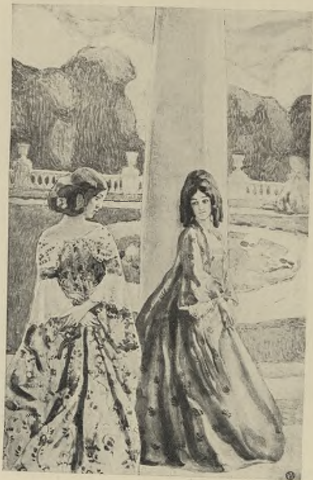
Встрѣча у колонны.