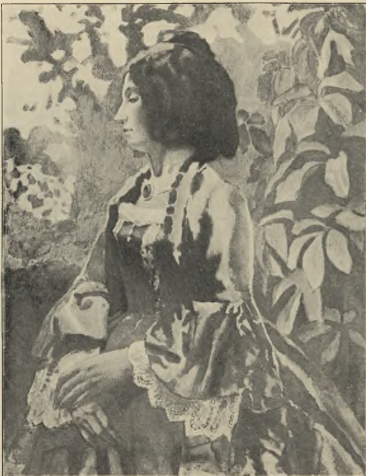
Портрет дамы в профиль.