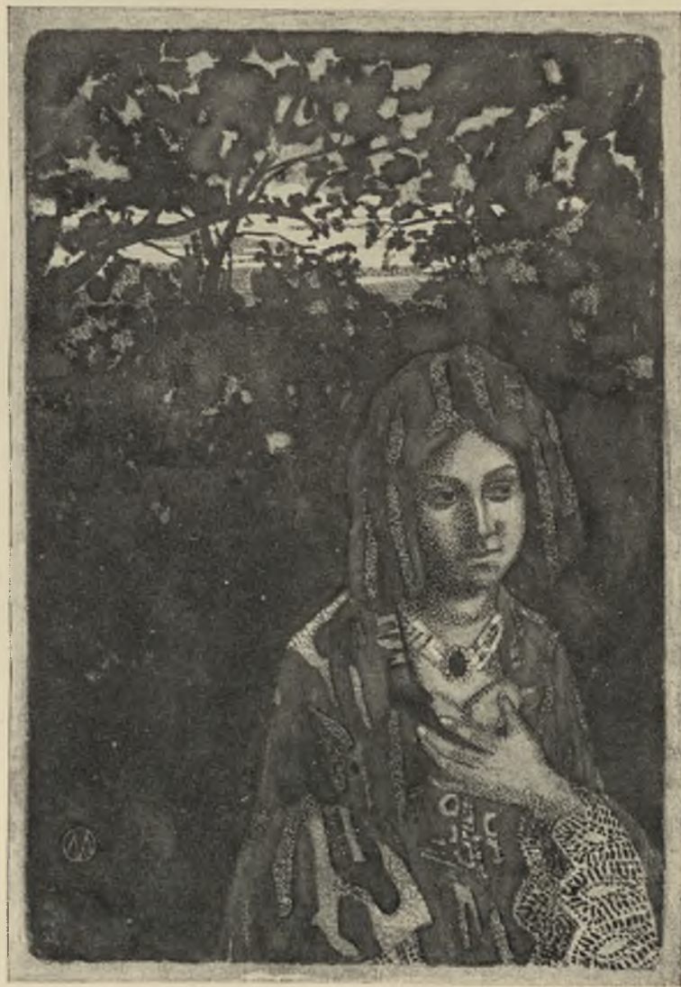
Рисунокъ для обложки. http://rcin.org/ Собств. Я. Н. Веретенникова. СПБ.