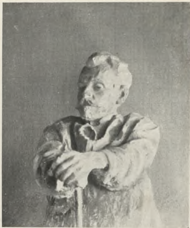
Бюсть работы А. Т. Матвѣева. (1900 г.).