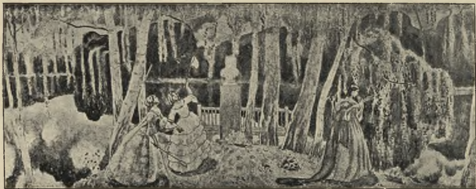
Весенняя сказка. (Эскизь для фресокъ).