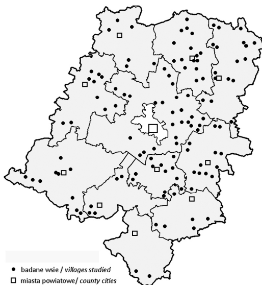
Ryc. 3. Rozkład przestrzenny wsi w województwie opolskim, w których oferty usług noclegowych zawierają odwołania do przeszłości