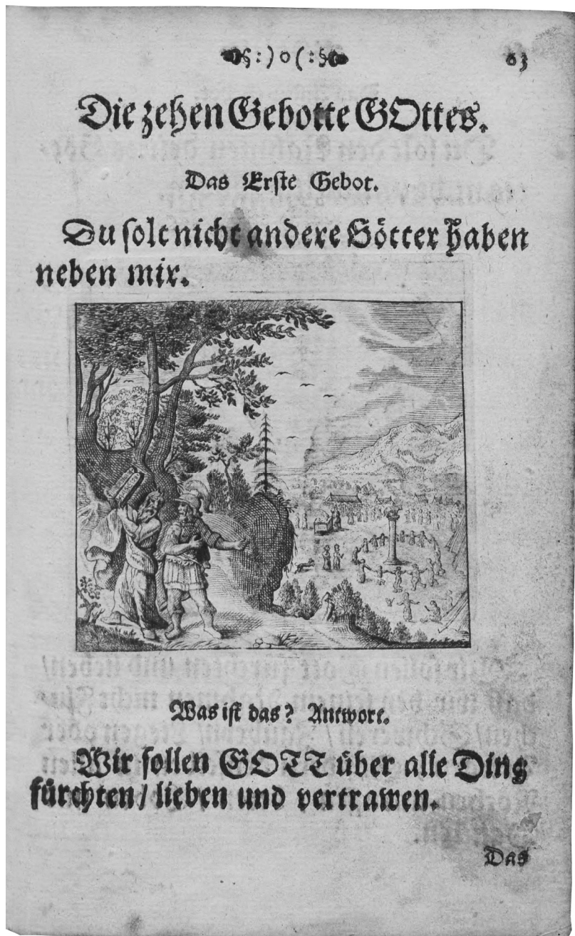
Il. 2. J. Löisentin, Christliche Hauszucht... , Dantzig: D. F. Rhete 1655, s. 63, BJ, sygn. Mus. ant. pract. L 1002, https://jbc.bj.uj.edu.pl/publication/292769/content (4 V 2018)