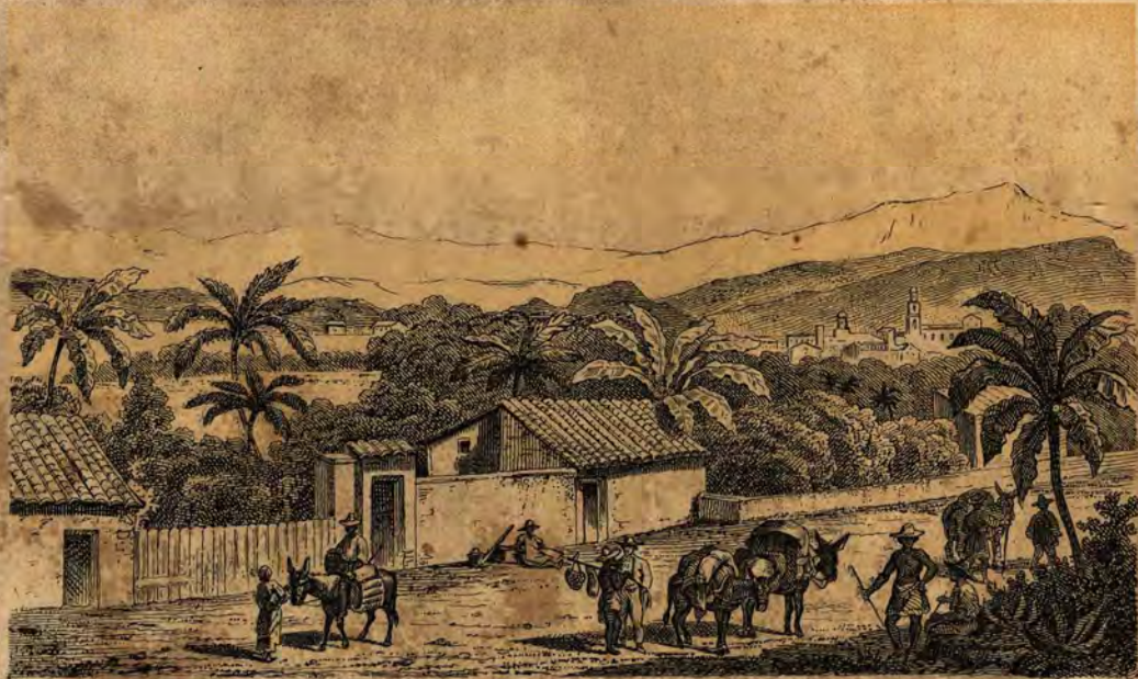
Jalapa in Mexico.