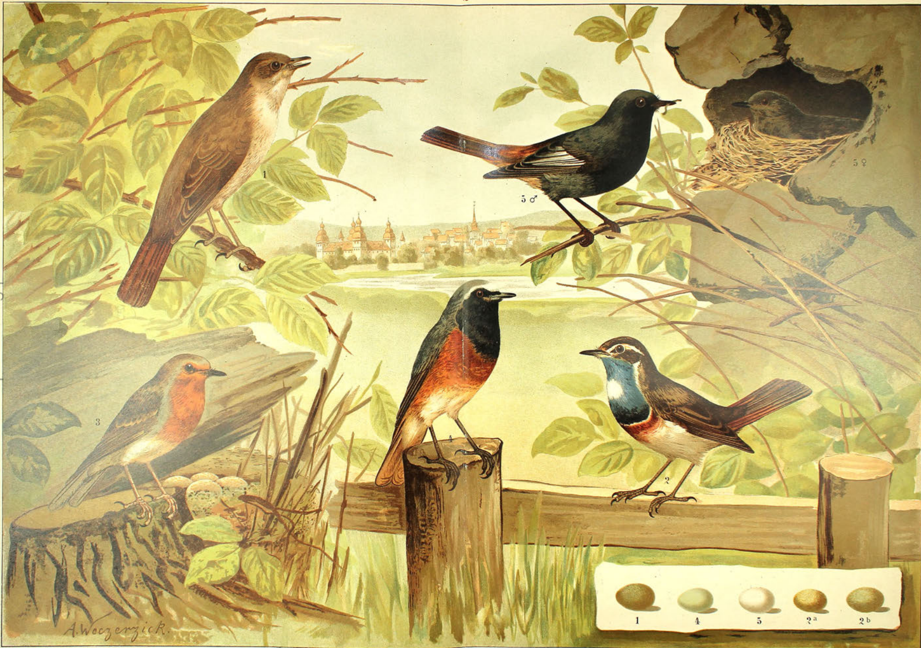
1. Bachfigall ( Erithacus lusciniæ ). 2. Blaukehlchen ( Erithacus cyanoculus ). 3. Rotkehlchen ( Erithacus rubecula ). 4. Gartenrotschwanz ( Erithacus phoeniceus ). 5. Hausrotschwanz ( Erithacus tytus ).