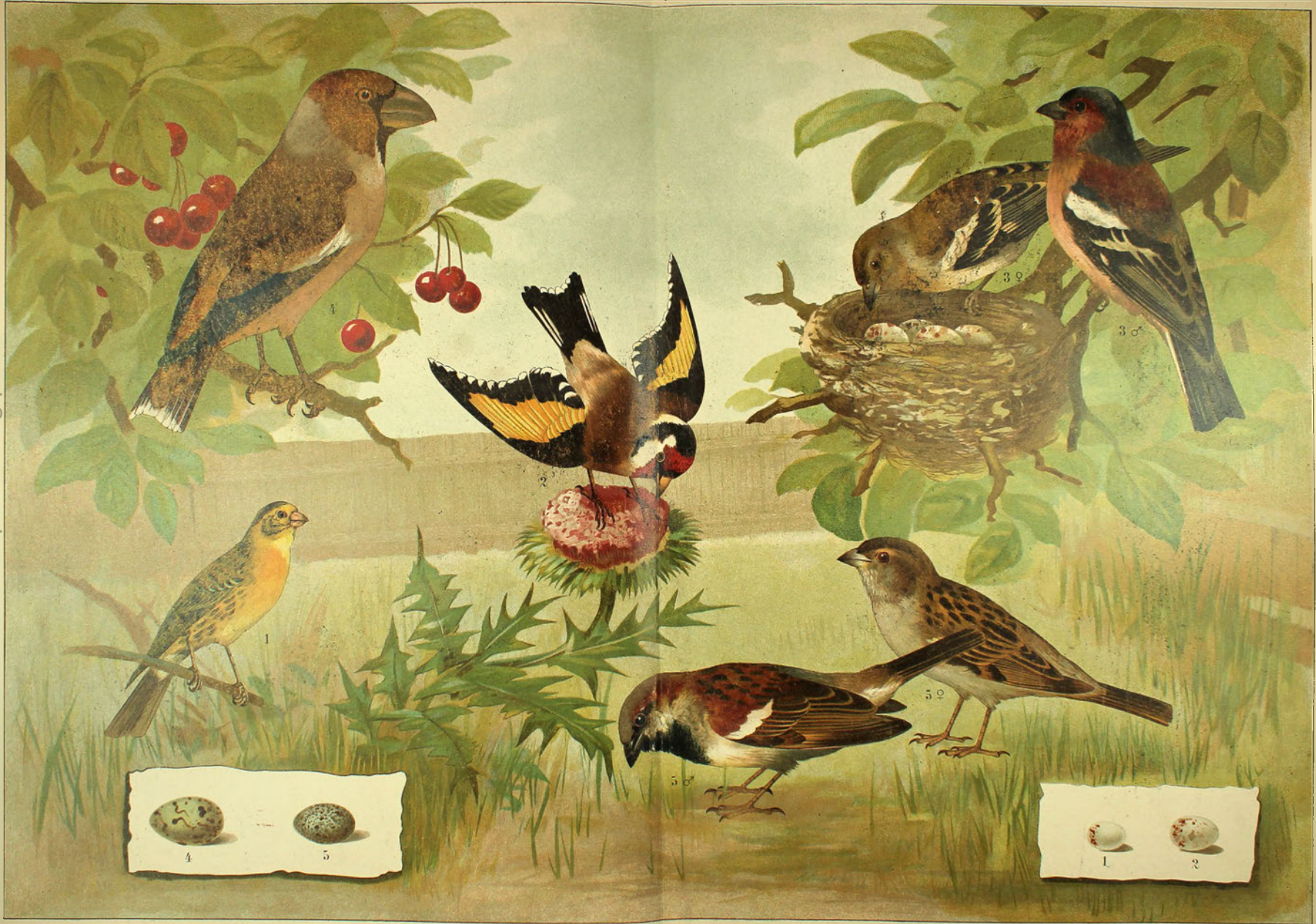
1. Girlig, Serinus hortulanus . 2. Steglitz, Carduelis elegans . 3. Buchfink, Fringilla coelebs . 4. Aitrdhkeimbefzer, Coccothrauster vulgaris . 5. Hausperling, Passer domesticus .