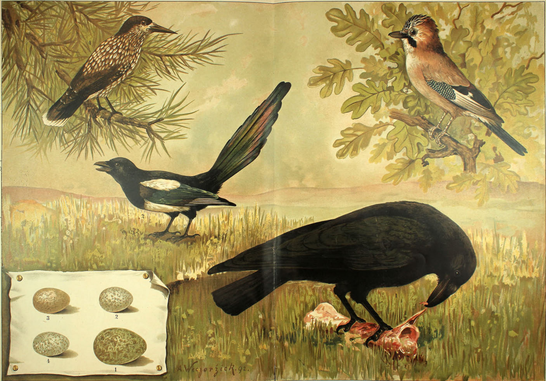
1. Kollkrabe, Corvus corax . 2. Elster, Pica rustica . 3. Eichelhäher, Garrulus glandarius . 4. Tannenhäher Nucifraga caryocatactes . (Eier in natürlicher Größe.)