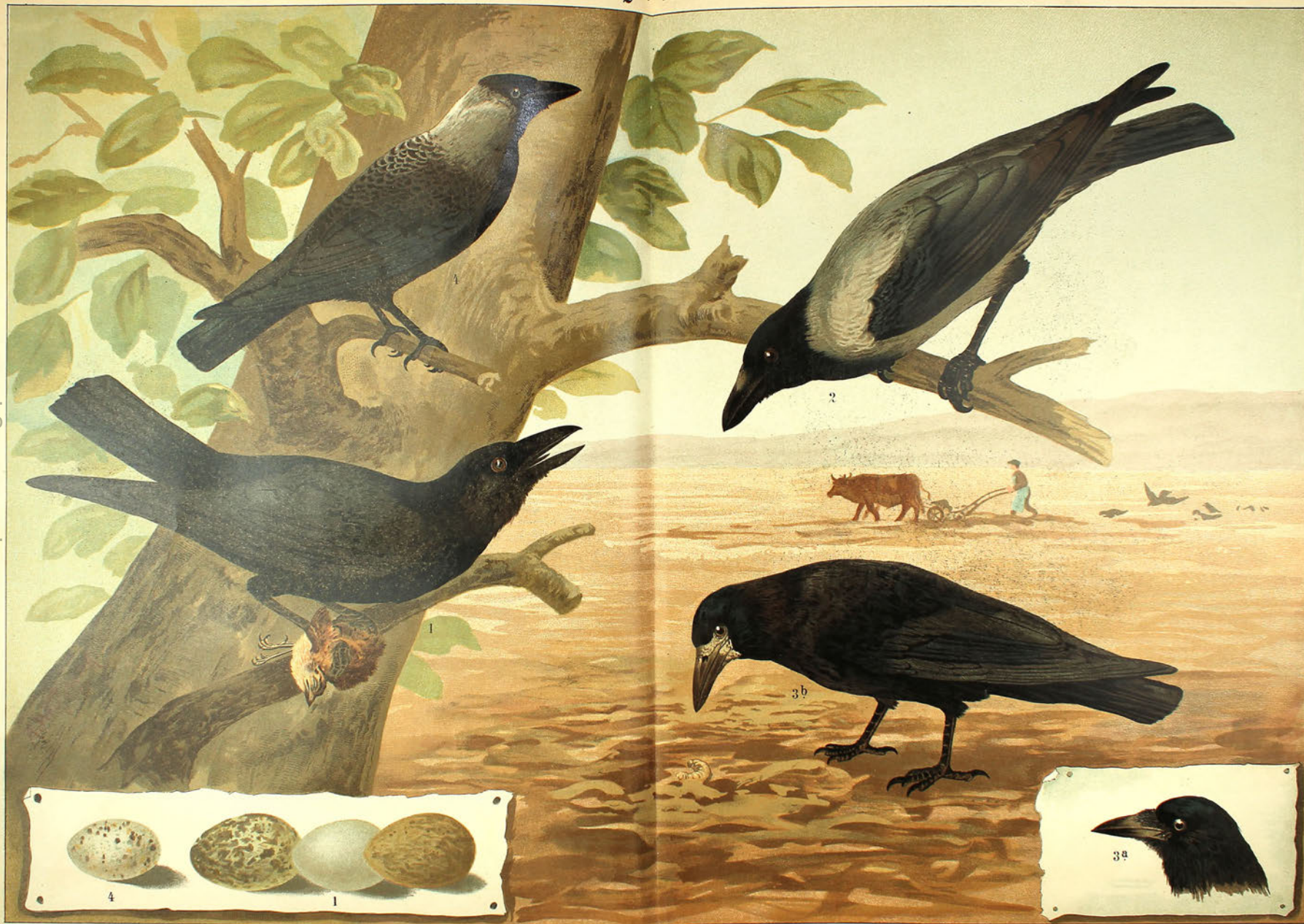
1. Rabenkrähe, Corvus corone . 2. Nebelkrähe, Corvus cornix . 3. Saatkrähe, Corvus frugilegus . 4. Dohle, Coloeus monedula . (Eier in natürlicher Größe.)